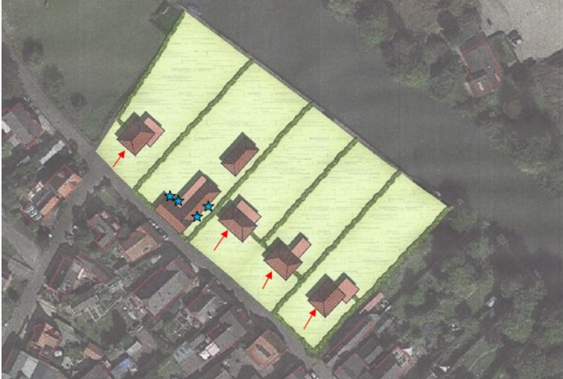
Figuur 2 Locaties van de tijdelijke (ster) en permanente (pijl) voorzieningen voor de gewone dwergvleermuis.