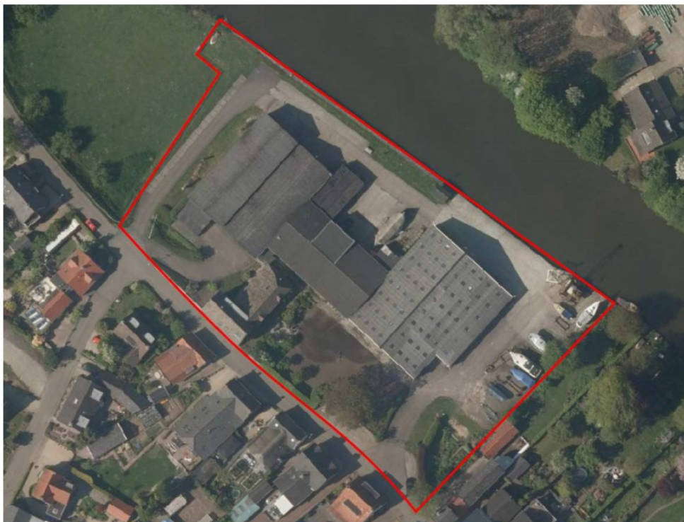
Figuur 1 Ligging plangebied (rode cirkel) en begrenzing plangebied (rood omlijnd).