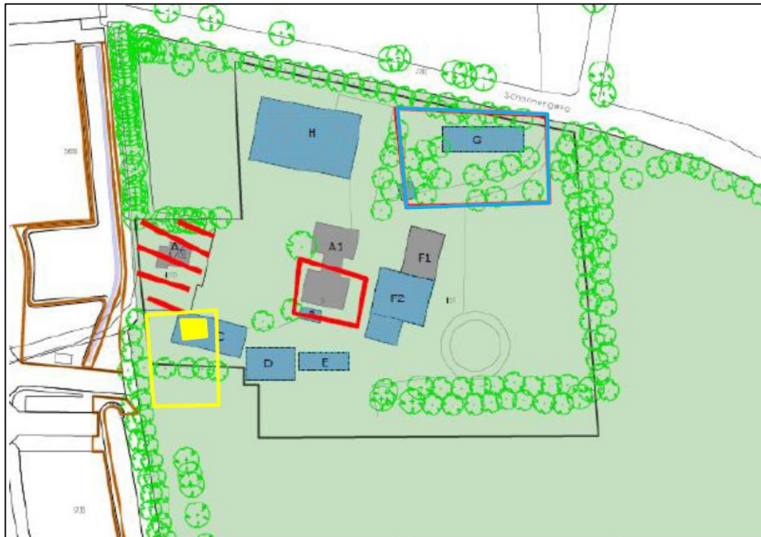
Figuur 1: Alsnog te slopen hoofdbebouwing (rood omlijnde)