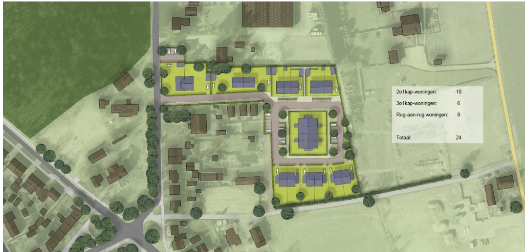
Figuur 1 locatie 24 te bouwen woningen