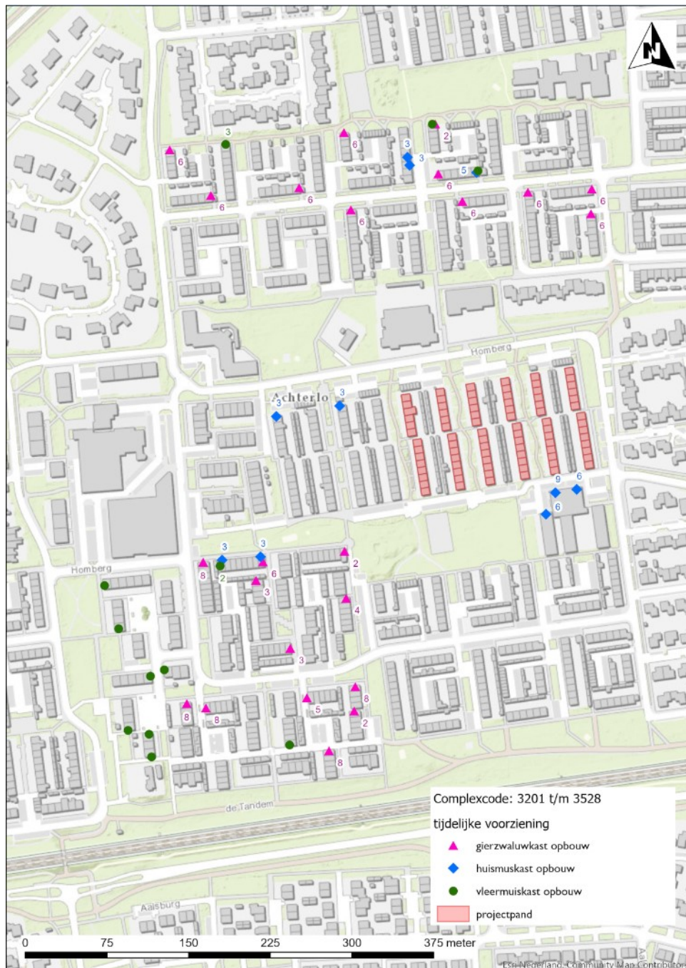
Figuur 1: Tijdelijke maatregelen huismuis, gierzwaluw en gewone dwergvleermuis