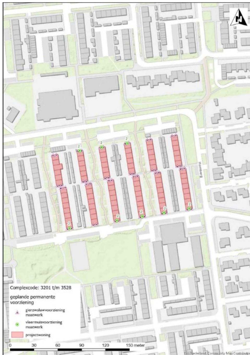
Figuur 2: Permanente maatregelen gierzwaluw (paars=zelfbouw nestplaats in dakoverstek) en gewone dwergvleermuis (groen = 2 geschakelde inbouwkasten). Voor de huismuis wordt bij alle woningen het vogelschroot op de derde panlat teruggeplaatst.