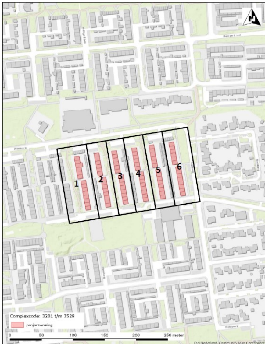
Figuur 1: Projectgebied Homberg 3201 t/m 3528 te Wijchen. Huizenblokken 1 t/m 6.