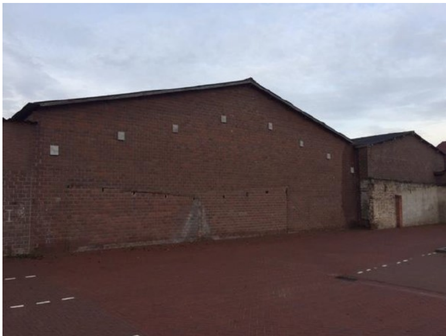
Figuur 3. Foto opgehangen vleermuiskasten.