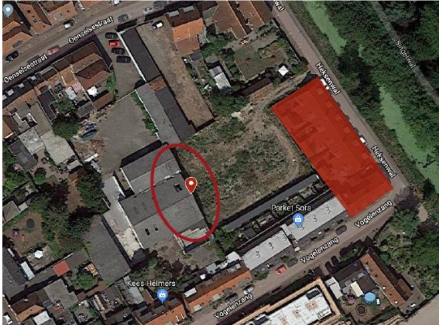
Figuur 2. Locatie tijdelijke vleermuiskasten aan bedrijfshal Oenselsestraat 46-48.