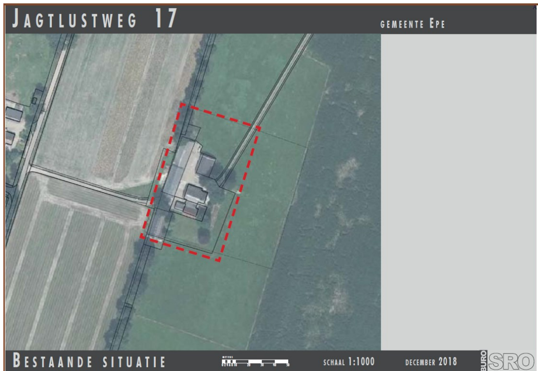
Figuur 1. Ligging en begrenzing plangebied Jagtlustweg 17 te Epe.