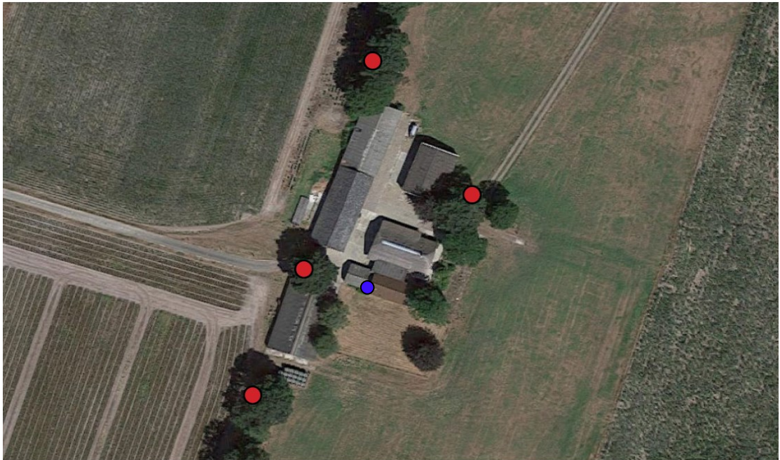
Figuur 1. Locaties tijdelijke vleermuiskasten (rode stippen) t.o.v. van de aangetroffen zomerverblijfplaats van de gewone dwergvleermuis (blauwe stip).