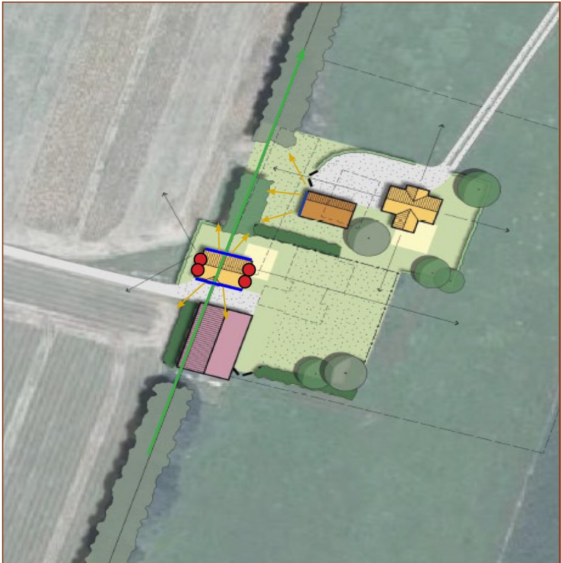
Figuur 3. Toekomstige situatie projectlocatie en locaties permanente verblijfplaatsen in de vorm van inbouwkasten (rode stippen).