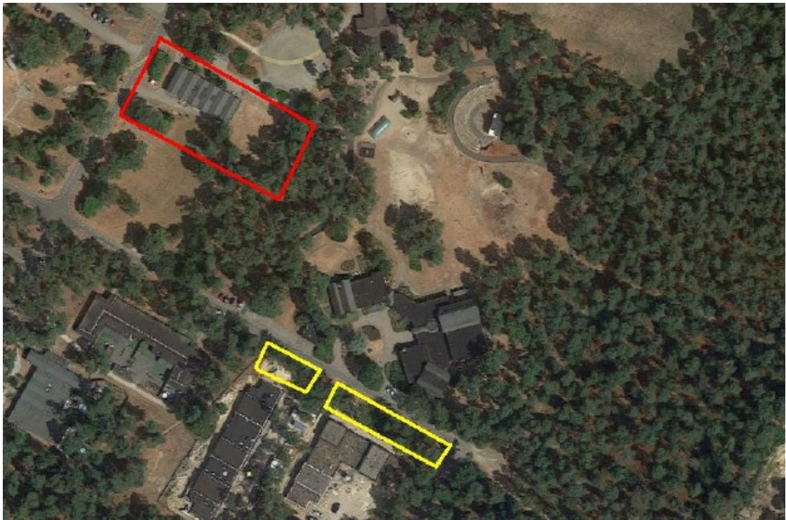
Figuur 4: Permanente alternatieve locaties voor de bunzing (geel) ten opzichte van het plangebied (rood)