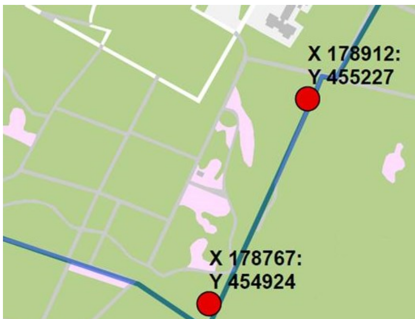
Figuur 3: Permanente alternatieve locaties voor de hazelworm inclusief rijksdriehoekskoördinaten.