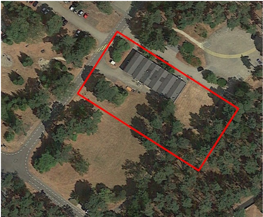
Figuur 1: Plangebied Bosuillaan 6, Wekerom