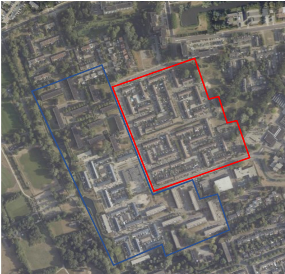
Figuur 1 Locaties tijdelijke voorzieningen voor vleermuizen (blauw omkaderd) en voor een deel van de tijdelijke nestkasten huismus. Binnen het plangebied (rood omkaderd) zullen de aanvullende tijdelijke voorzieningen (40 kasten) voor de huismus worden geplaatst. Definitieve locaties van de opgehangen tijdelijke voorzieningen en permanente voorzieningen voor vleermuizen, worden aan de provincie gestuurd voor 15 mei 2021 .