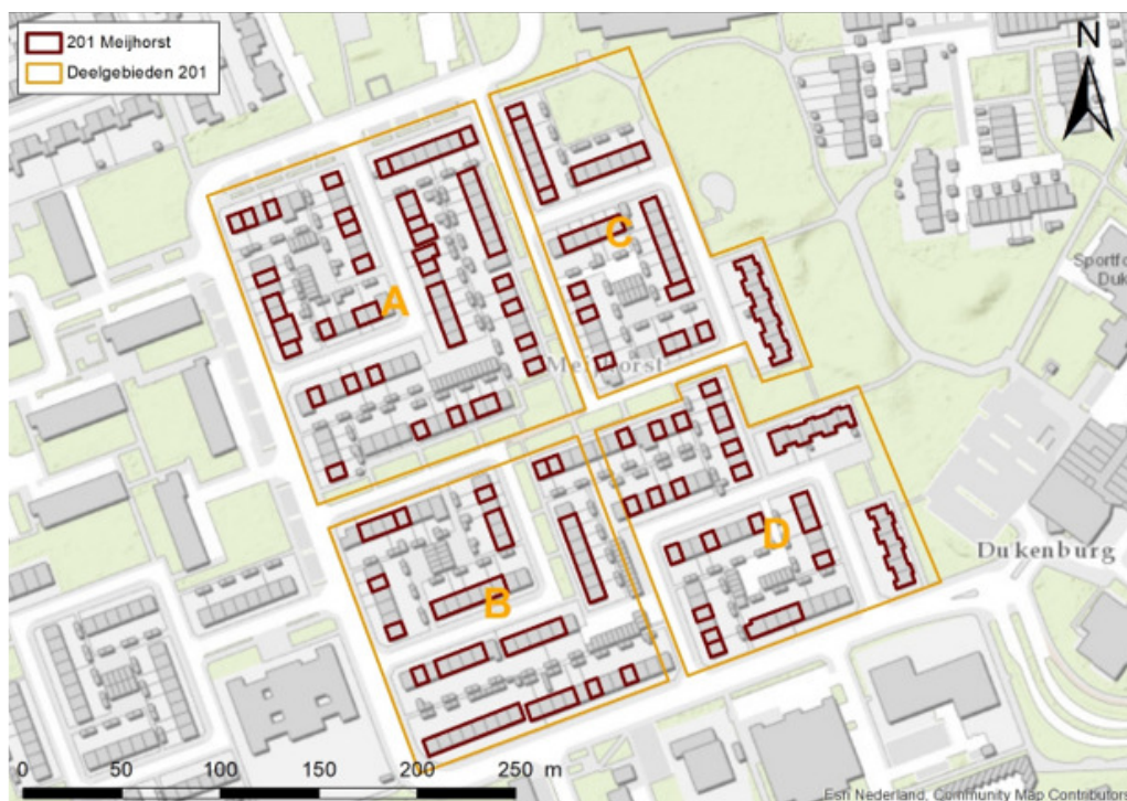
Figuur 1 Plangebied (complex 201) Meijhorst te Nijmegen