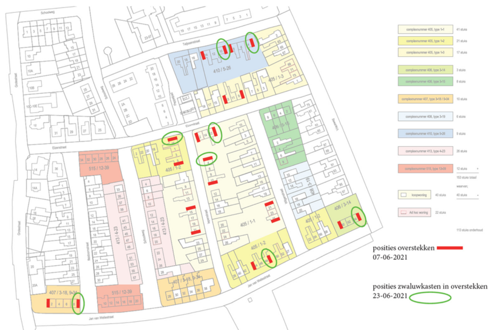
Figuur 4. Locaties van de permanente voorzieningen voor de gierzwaluw. In de groen omcirkelde kopgevels worden permanente voorzieningen voor de gierzwaluw gerealiseerd.