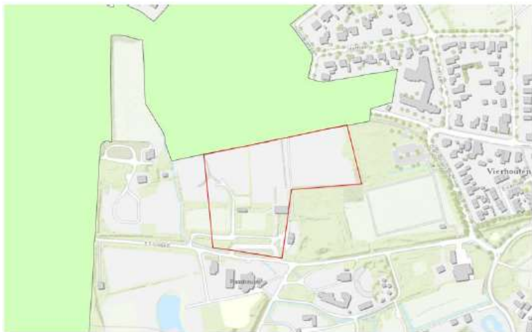
Figuur 1 Ligging plangebied (rood omkaderd) ten opzichte van Natura 2000-gebieden (groen) (Esri Nederland, Community Map Contributors | Esri Nederland, beeldmateriaal.nl | Esri Nederland, Kadaster | Esri Nederland, AHN).

Ligging projectlocatie (Bron: Ecologische beoordeling stikstof Groepsaccommodatie Hotel Heppie II, Vierhouten Toetsing in het kader van de Wet natuurbescherming, Bureau Waardenburg, d.d. 5 februari 2021)