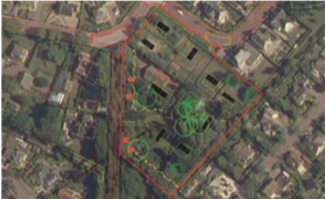
Figuur 2: locaties van de gerealiseerde eekhoornkasten met rode stippen aangegeven (Kloen, 2021)