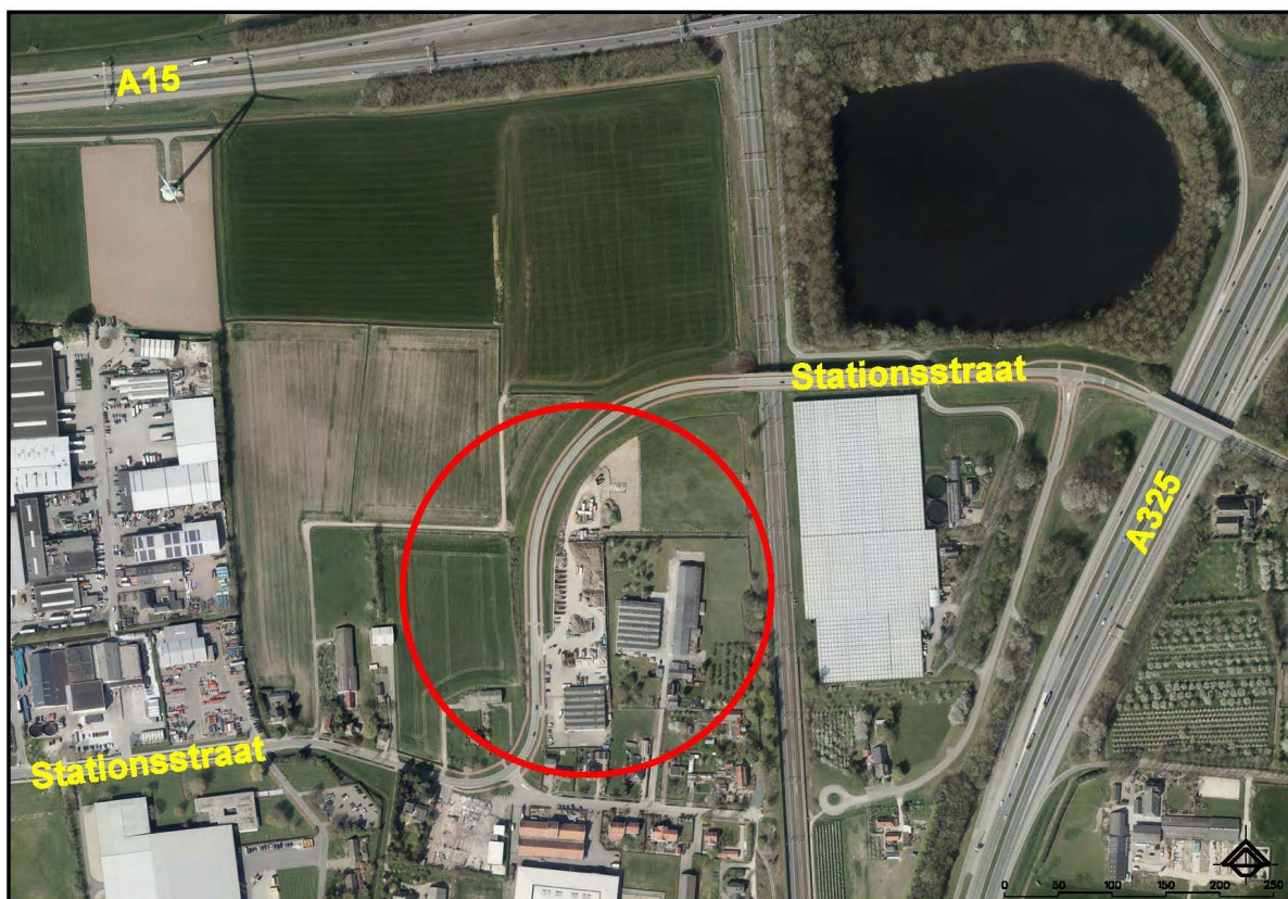
Figuur 1: locatie Stationsstraat 82 in Nijmegen

Namens Aannemers- en Grondverzetbedrijf van Wijk B.V., Stationsstraat 28, 6515 AB te Nijmegen is verzocht om een omgevingsvergunning voor de activiteit "Handelen in strijd met regels ruimtelijke ordening" voor het uitbreiden van haar bedrijfsactiviteiten met een houtshredder op het adres Stationsstraat 82 te Nijmegen.