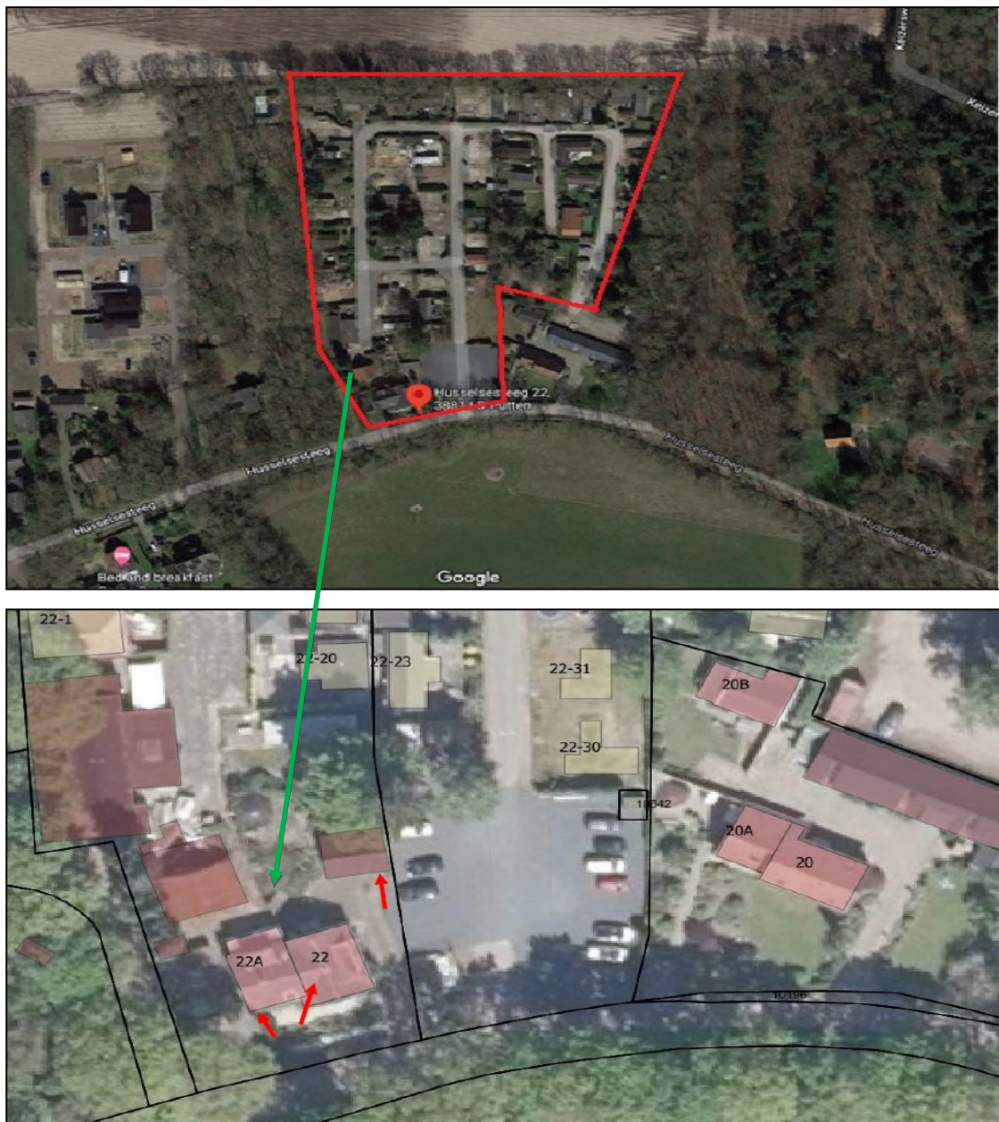
Figuur 1. Ligging en begrenzing van het plangebied aan de Husselsesteeg 22 en 22a te Putten (afbeelding boven). Op de onderste afbeelding zijn de locaties van de drie nesten van huismus met rode pijlen in de te slopen bebouwing weergegeven.