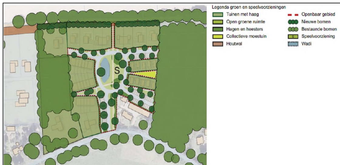
Figuur 2. De locaties van de zes tijdelijke voorzieningen in de vorm van een met dakpannen overkapte wand met huismuskasten van het type NK MU o8 of soortgelijk (rode cirkels aan de Husselsesteeg 20, afbeelding boven). Op de onderste afbeelding is een plattegrond van de nieuwe situatie met de nieuwe groeninrichting en aan te leggen wadi weergegeven.