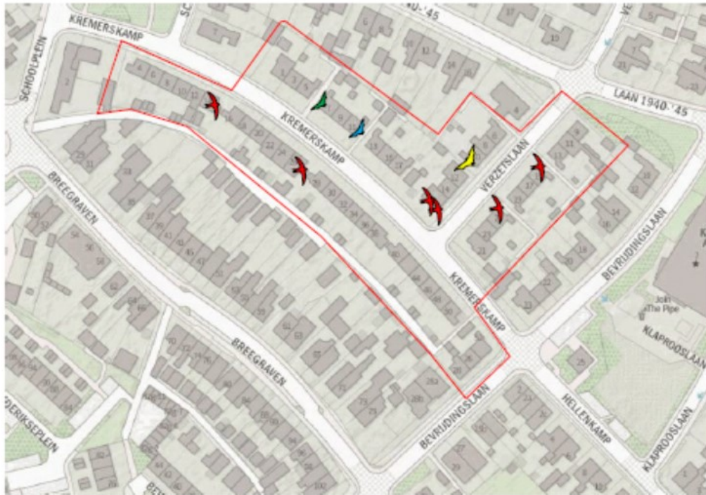
Figuur 3: Ligging van de woningen met gierzwaluwnesten in projectgebied Kremerskamp en Verzetslaan te Warnsveld. De rode vogelsymbolen zijn gierzwaluwnesten binnen het projectgebied en de ander symbolen betreffen verblijfplaatsen van vleermuizen.