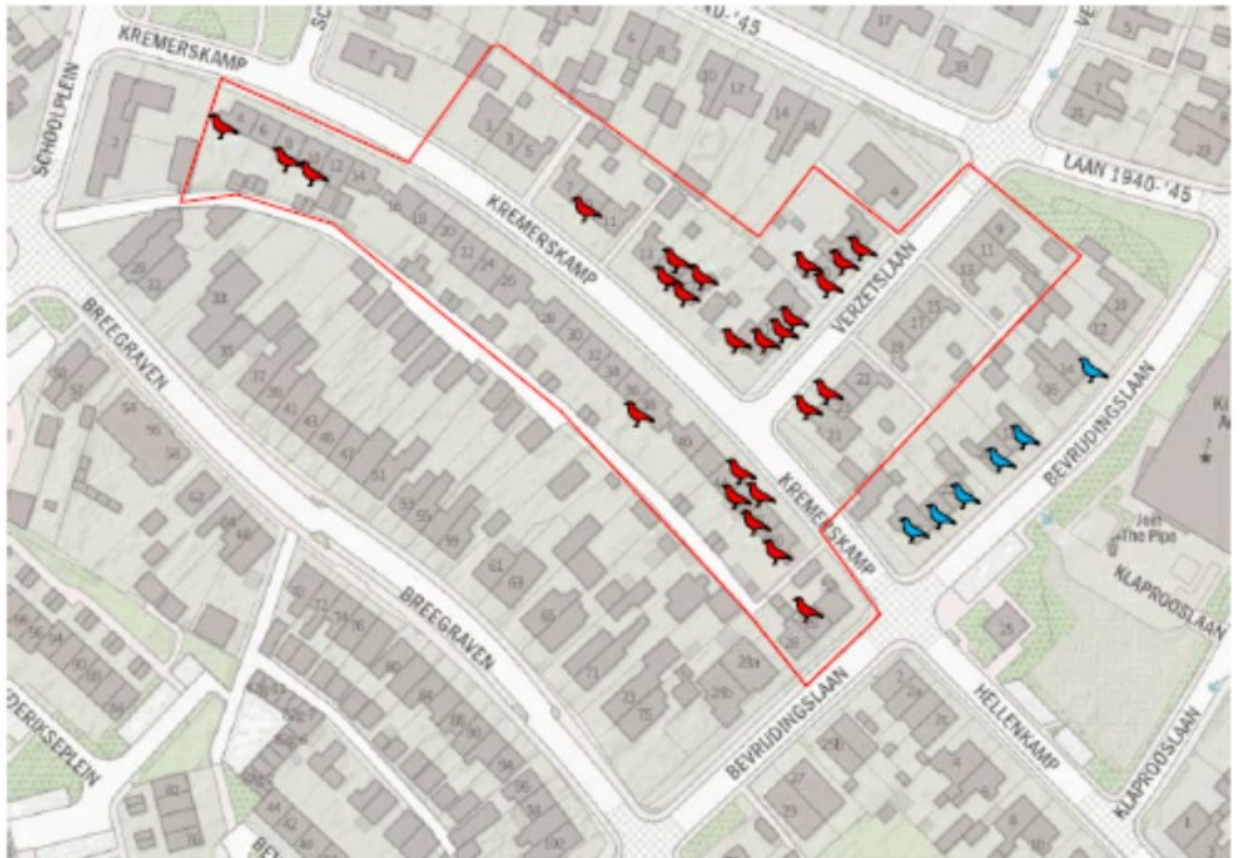
Figuur 2: Ligging van de woningen met huismusnesten in projectgebied Kremerskamp en Verzetslaan te Warnsveld. De rode vogelsymbolen zijn huismusnesten binnen het projectgebied en de blauwe symbolen die buiten het projectgebied.