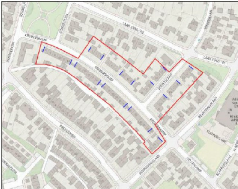
Figuur 5: Ligging van de aan te brengen permanente mitigerende maatregelen in metselneststenen in kopgevels voor gierzwaluw (blauwe lijnen).