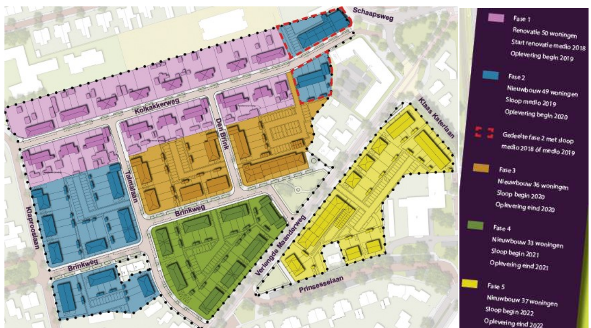
Figuur 2 Oorspronkelijke verdeling plangebied per fase.