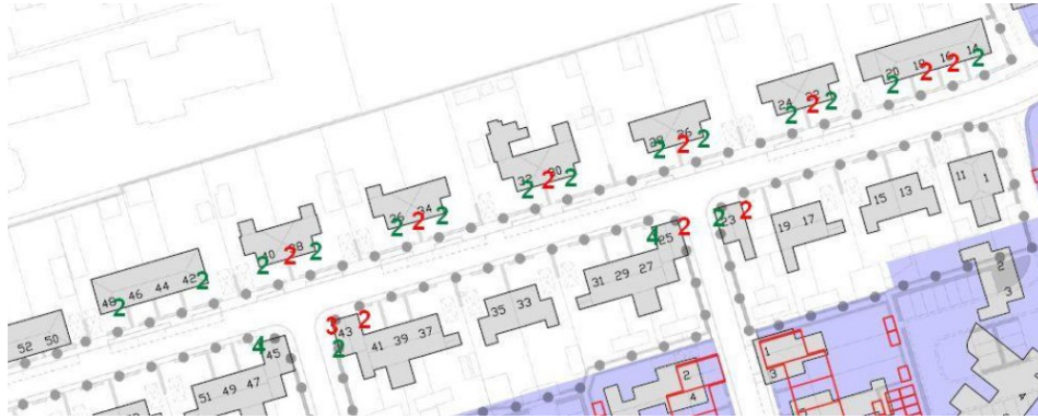
Figuur 1 Locaties en aantallen van de tijdelijke voorzieningen voor de huismus (rood) en vleermuisen (groen) aan woningen aan de Kolkakkerweg (fase 1).