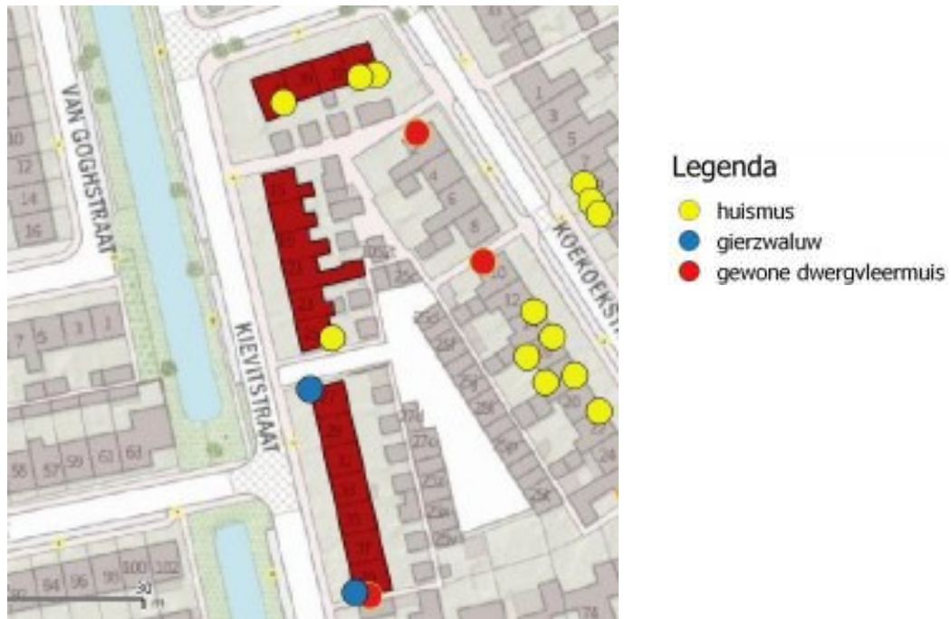
Figuur 1 Plangebied inclusief vastgestelde verblijfplaatsen van beschermde soorten.