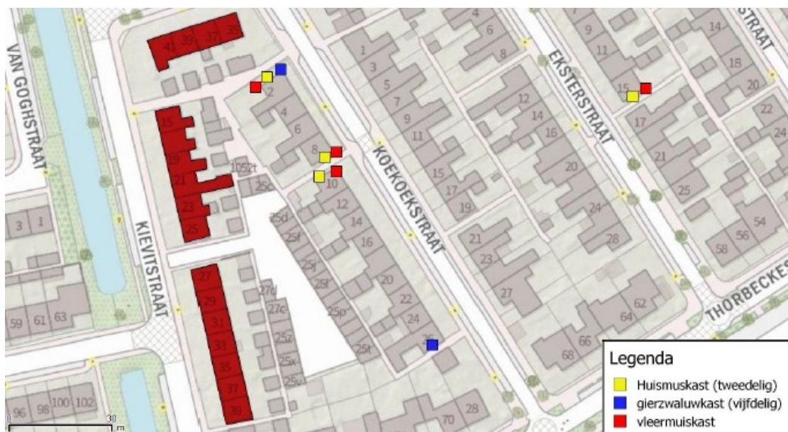
Figuur 2 Locaties van de tijdelijke voorzieningen voor huismus, gierzwaluw en gewone dwergvleermuis.