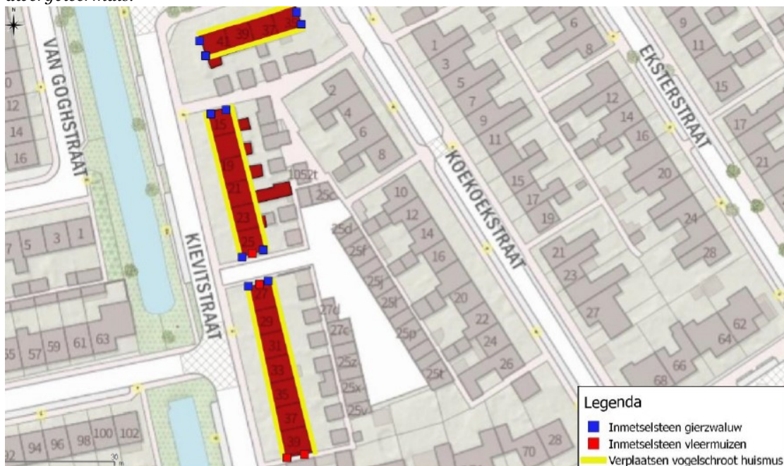
Figuur 3 Locaties van de permanente voorzieningen voor de huismus, gierzwaluw en gewone dwergvleermuis. De twee te realiseren inbouwkasten voor gierzwaluw aan de Fazantstraat 35 worden verplaatst naar de woning aan de Kievitstraat 39.