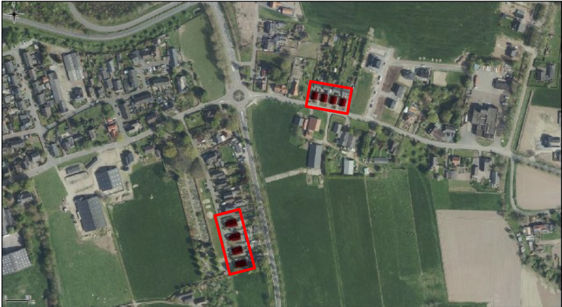
Figuur 1. Ligging en begrenzing plangebied Dorpsstraat 71 t/m 85 (boven) en Het Kruisveld 23 t/m 27 oneven (onder) te Angerlo.