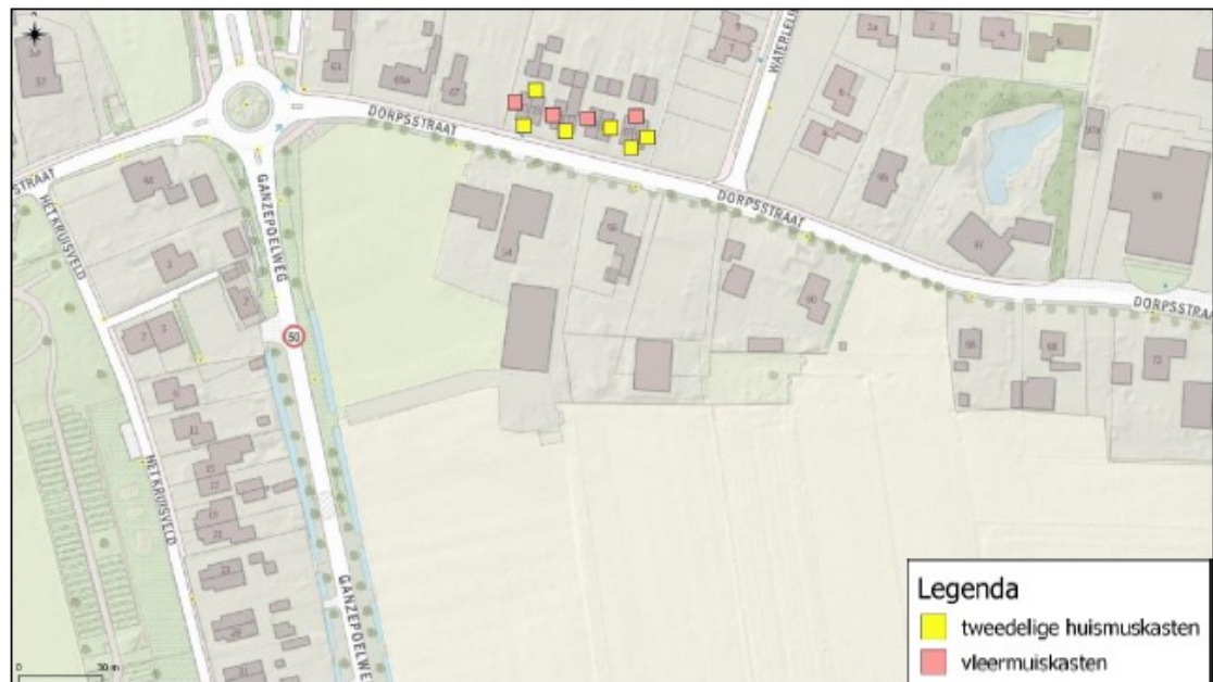
Figuur 2. Locaties mitigerende maatregelen aan de woningen aan de Dorpsstraat 71 t/m 85 te Angerlo. Er dient nog een extra huismuskast te worden opgehangen, dit is opgenomen als aanvullend voorschrift.