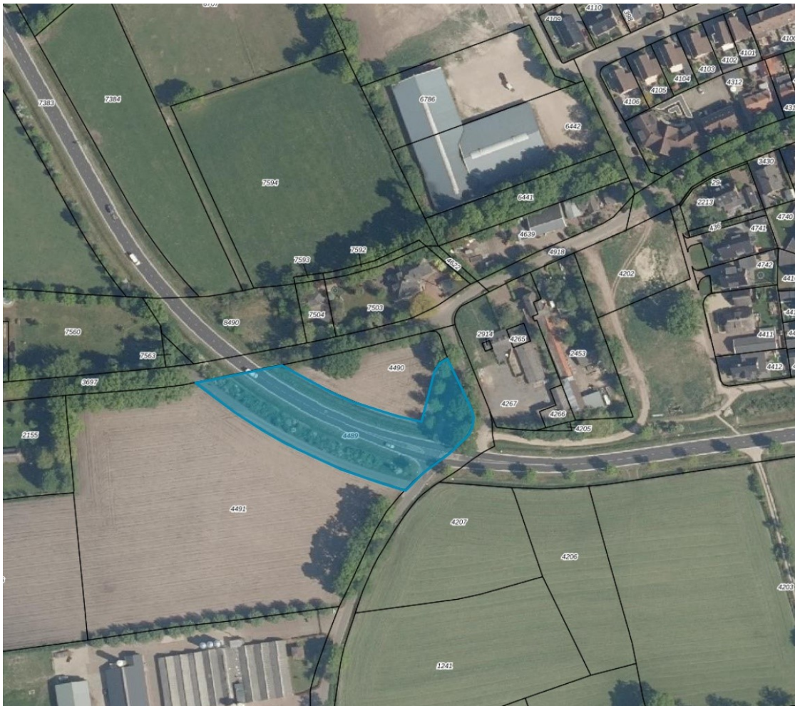
Figuur 4: Ligging kadastraal perceel Lunteren sectie C nummer 4489 waarop bomen worden herplant.