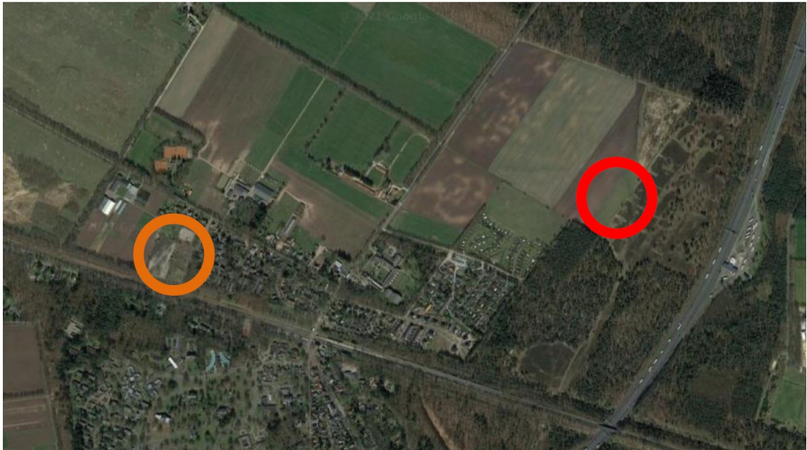
Figuur 2: Ligging compensatiegebied (rode cirkel) ten opzichte van het plangebied (oranje cirkel)