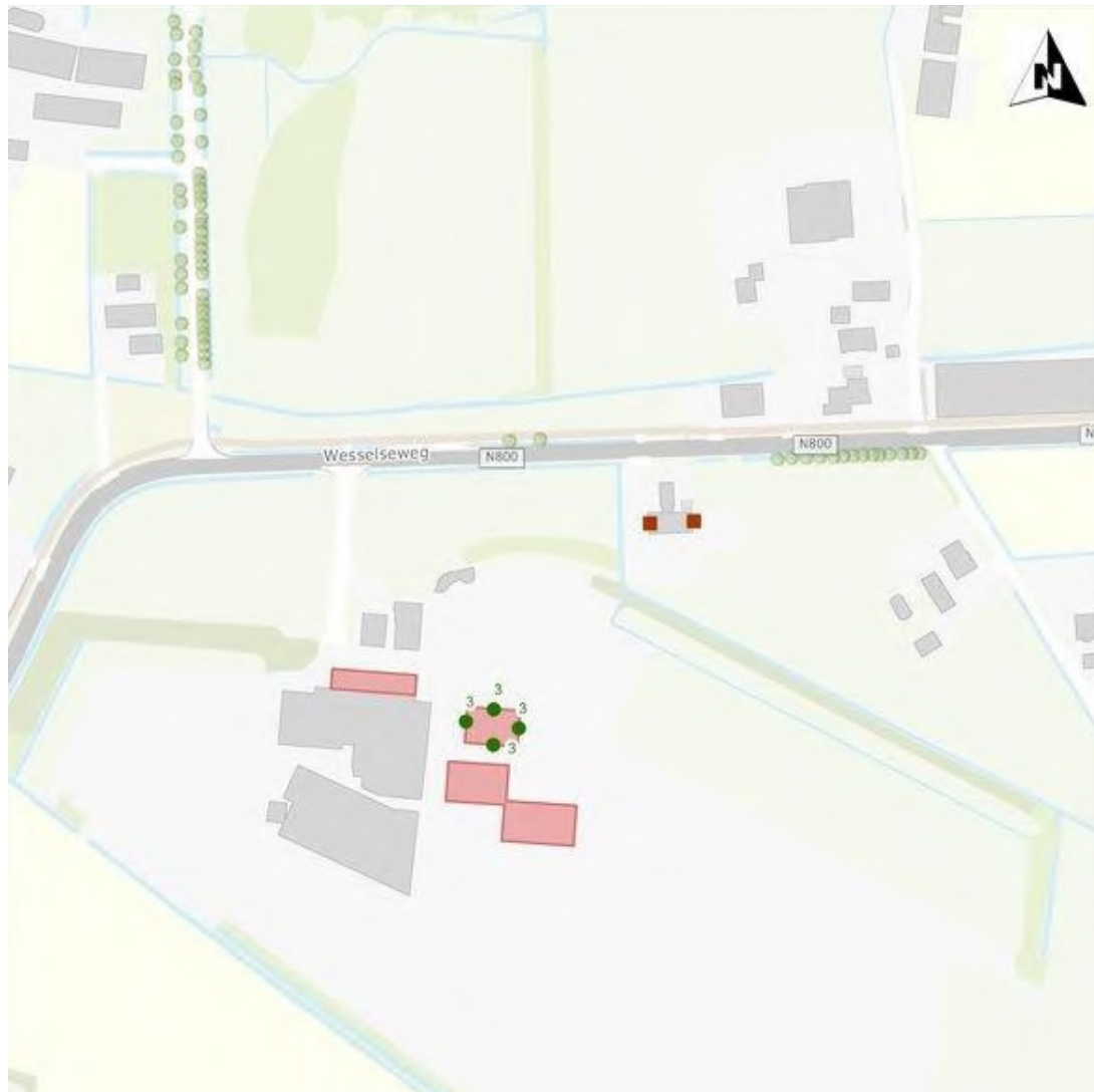
Figuur 2: locaties van de tijdelijke voorzieningen. De groene stippen geven de locaties weer van de vleermuiskasten, rode vierkanten de tijdelijke kerkuilkasten (Claessens-Isarin, 2021)