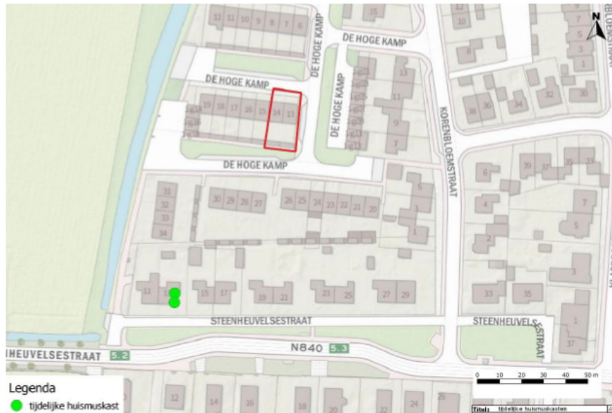
Figuur 2 Locaties van de tijdelijke voorzieningen voor de huismus.