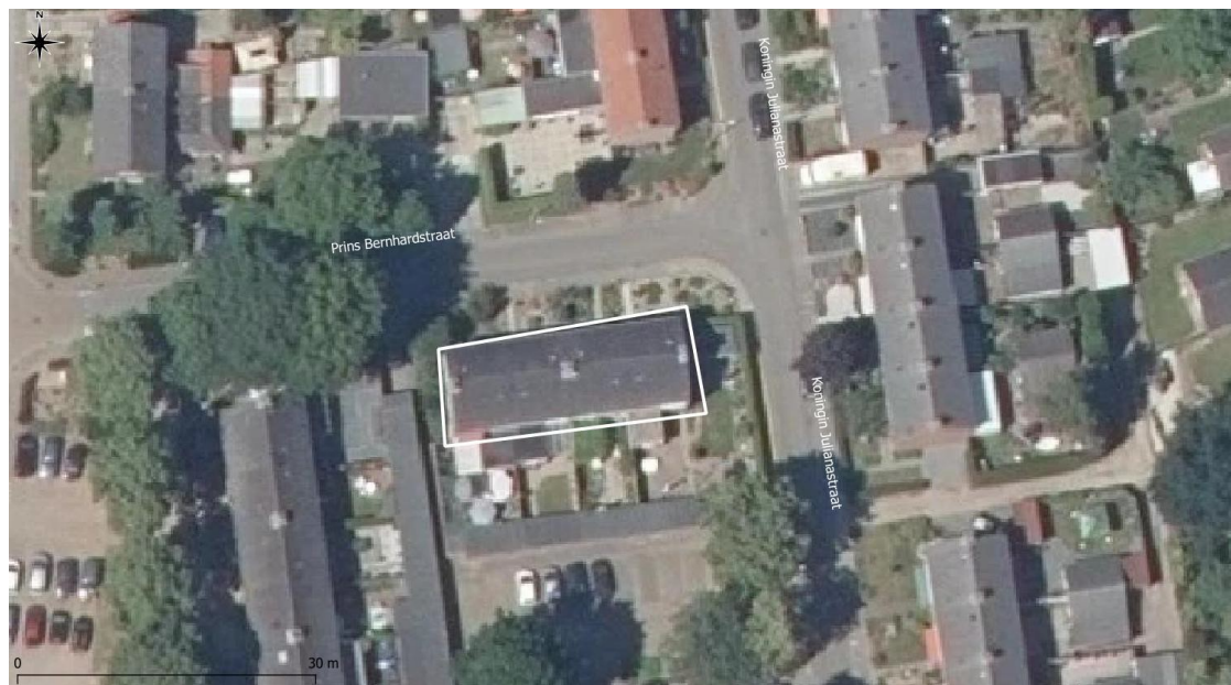
Figuur 1: Plangebied binnen witte kader (Driessen, 2021)