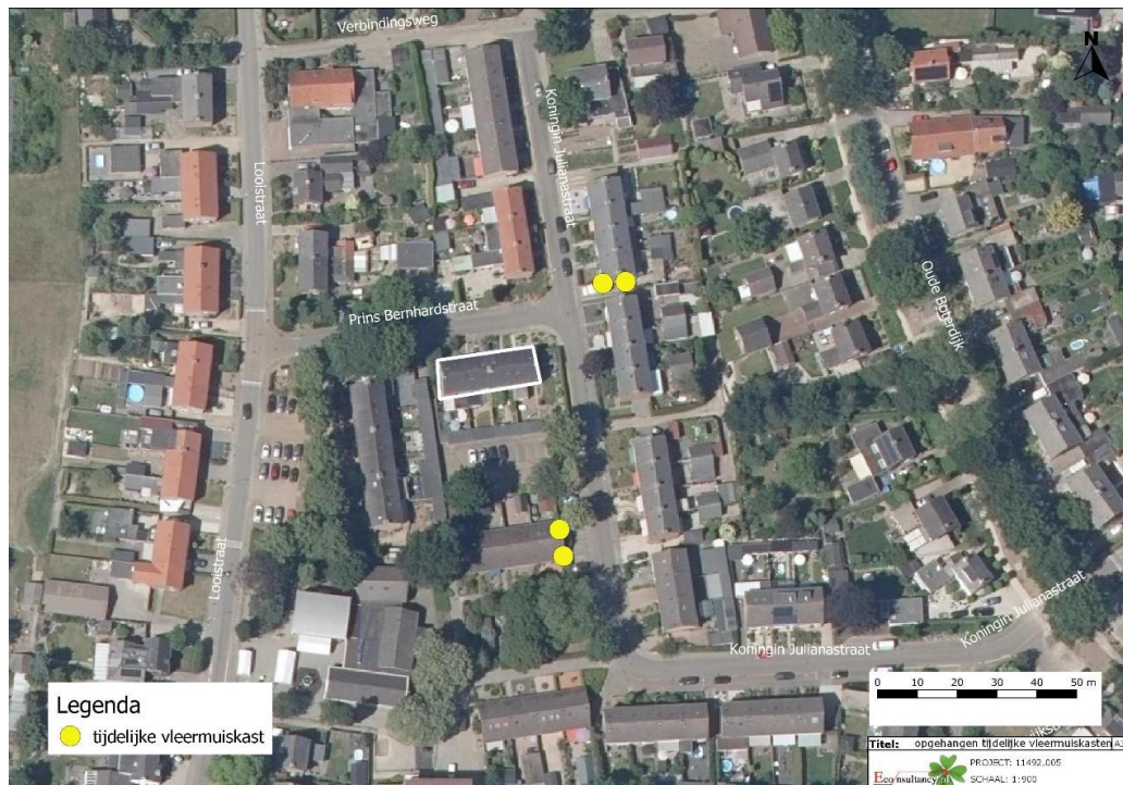
Figuur 3: locaties tijdelijke vleermuiskasten aangegeven met gele stippen (Driessen, 2021)