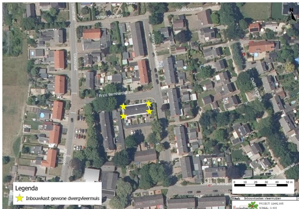
Figuur 4: locaties permanente inbouwkasten voor vleermuizen aangegeven met gele sterren (Driessen, 2021)