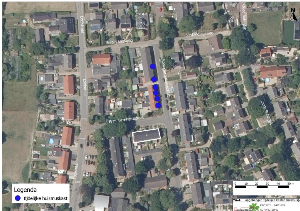
Figuur 2: locaties tijdelijke huismuskasten aangegeven met blauwe stippen (Driessen, 2021)