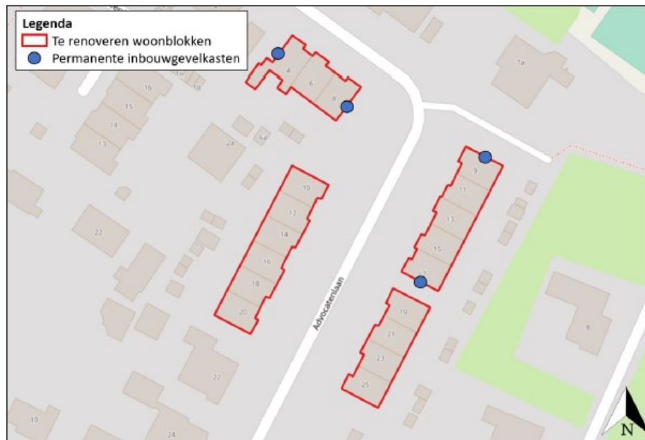
Figuur 3.6 De inbouwstenen worden gerealiseerd in de gevels.