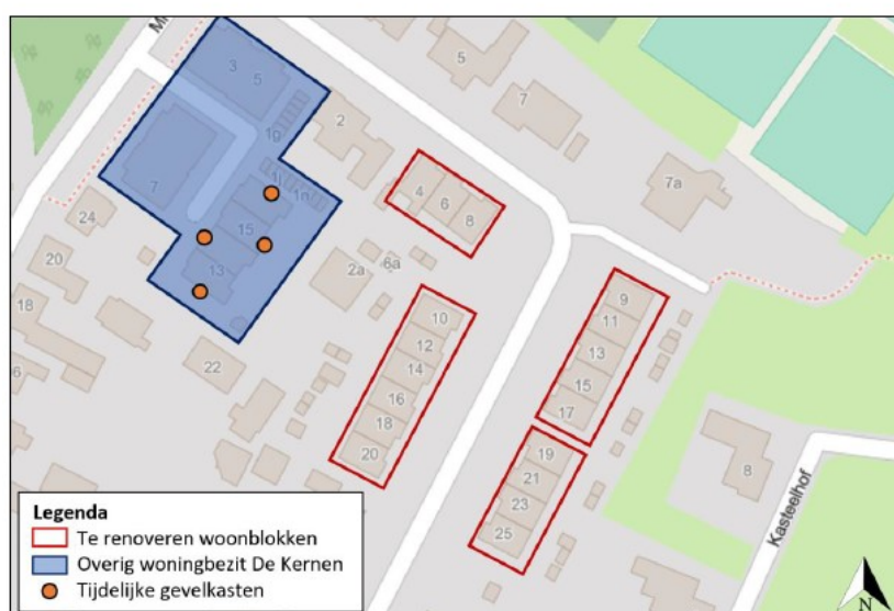
Figuur 3.5 Tijdelijke alternatieve voorzieningen voor de gewone dwergvleermuizen worden gerealiseerd aan de kopgevels van De Geerden 13 en 16.