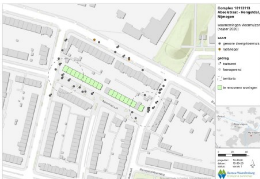
Figuur 4.3 Waarnemingen van vleermuizen augustus – september 2020, Abeelstraat (kavels 10113113 en 10113114) Nijmegen.