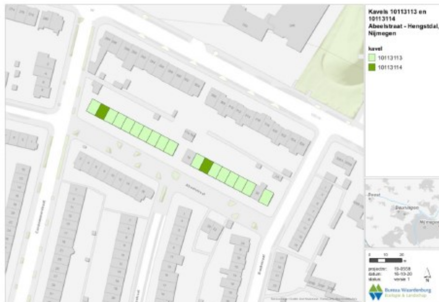
Figuur 2.1 Ligging te renoveren woningen van kavels 10113113 en 10113114 te Nijmegen.