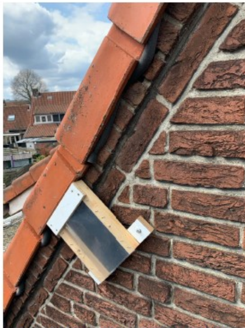
Geplaatste exclusion flap bij dakrand kopse gevel.