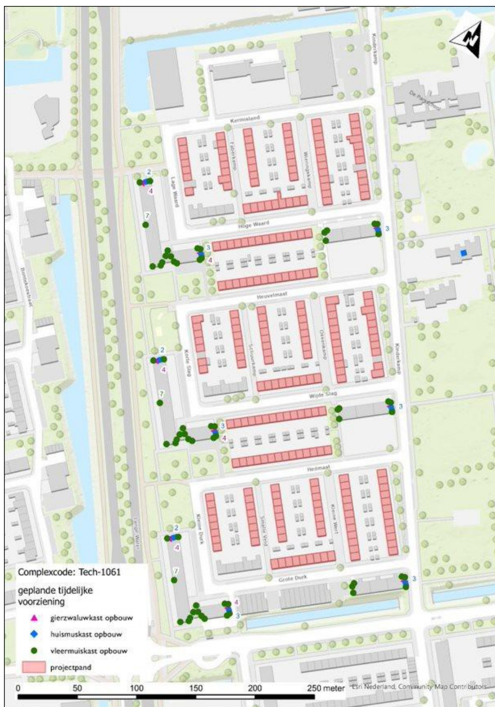
Figuur 1: Overzicht van alle geplaatste tijdelijke voorzieningen.