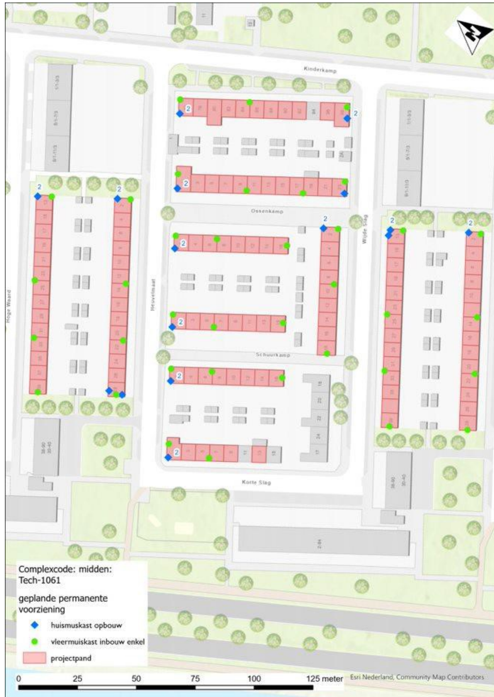
Figuur 6: Detail locaties permanente voorzieningen voor deel midden.