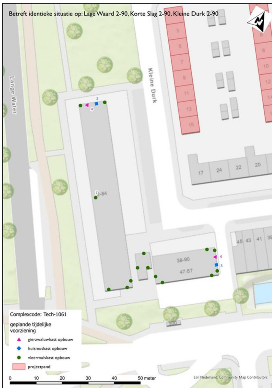
Figuur 3: Detail plaatsing kasten op Kleine Durk 2-90. Deze plaatsing van kasten is vergelijkbaar op Korte Slag 2-90 en Lage Waard 2-90.