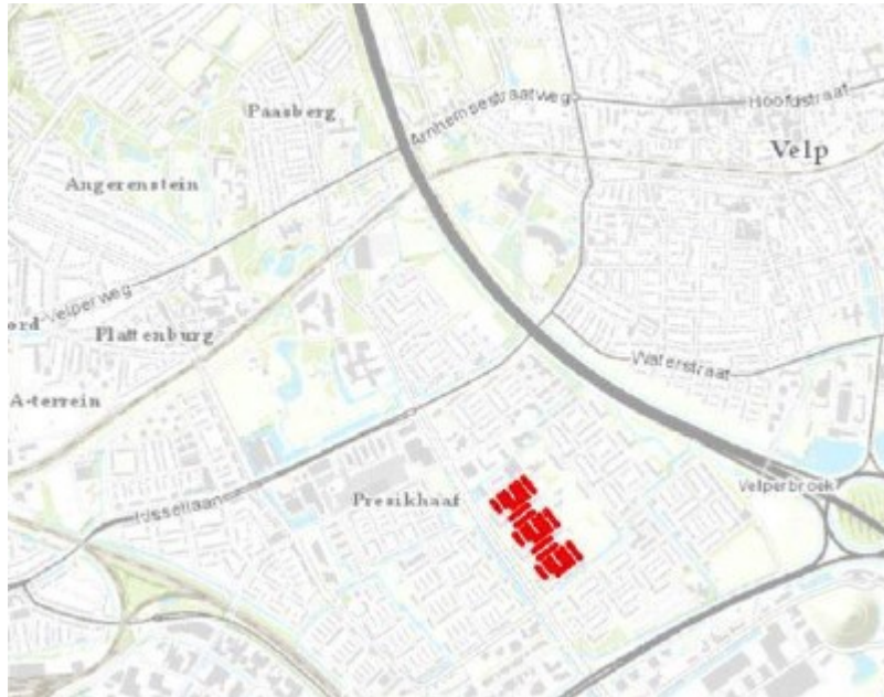
Figuur 1: Kaart projectgebied (rode vlakken)