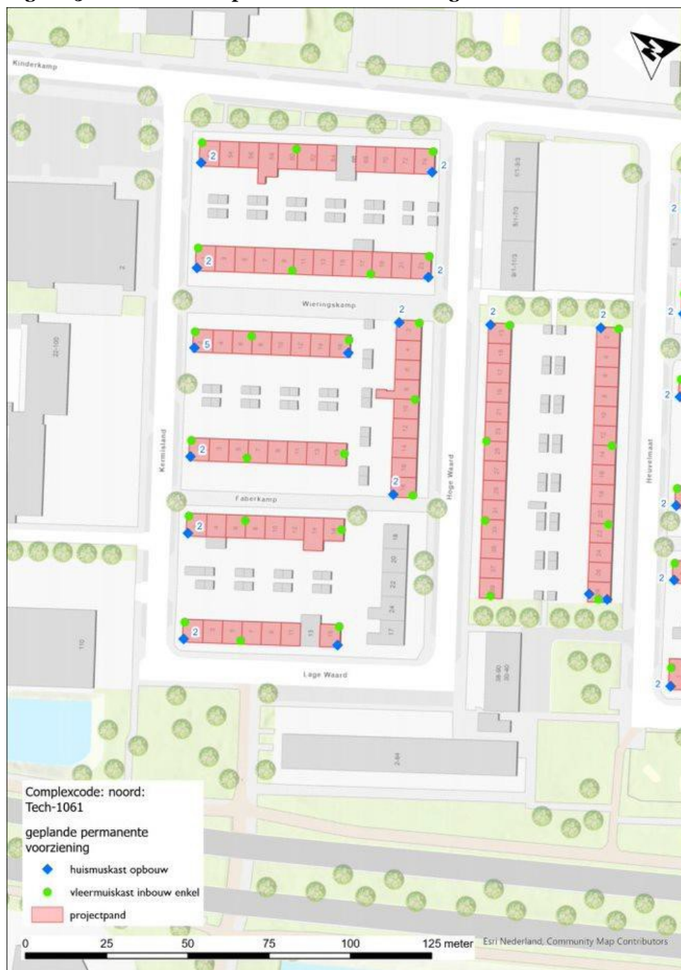
Figuur 5: Detail locaties permanente voorzieningen voor deel noord.

Toelichting: Indien er per gevel meer dan één kast geplaatst is, is het betreffende aantal weergegeven met een label, bijvoorbeeld '3'.