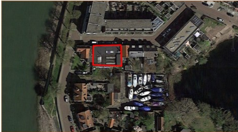
Figuur 2. Oude bedrijfsgebouw in Zutphen (rood).