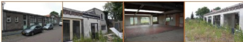
Foto 1 t/m 4: Foto's van het oud bedrijfsgebouw in Zutphen.