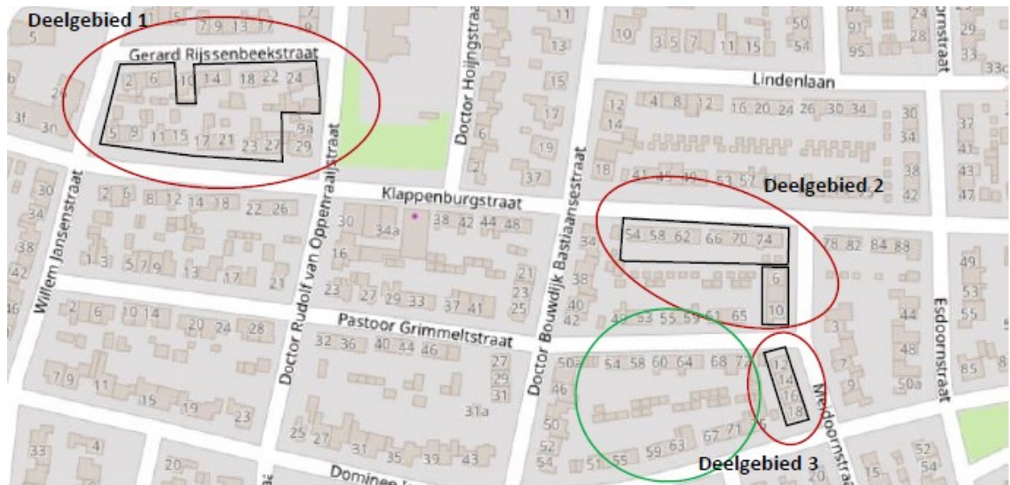
Figuur 1 Begrenzing plangebied (rood omcirkeld).