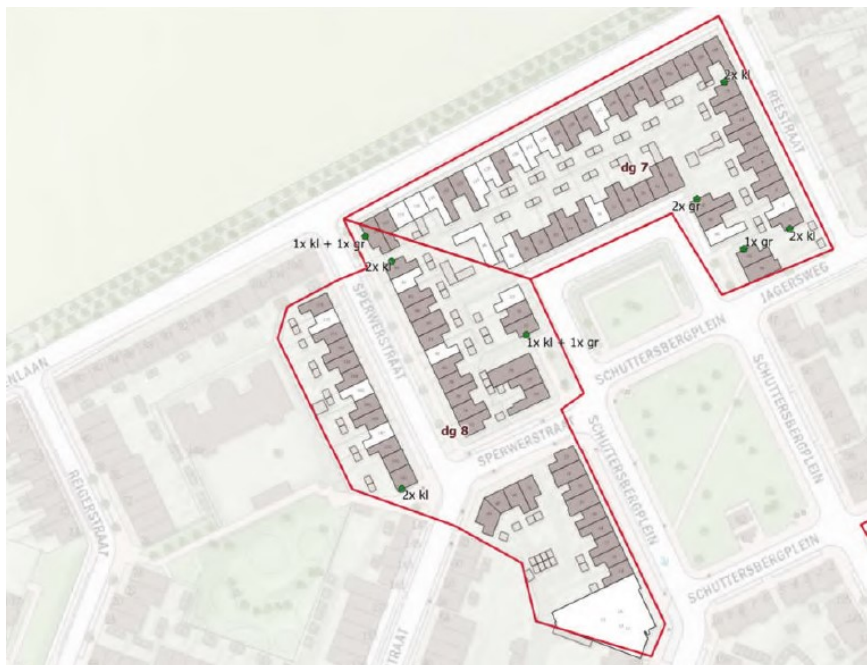
Figuur 5. Deelgebied 7 en 8 met 10 kleine en 5 grote vleermuiskasten