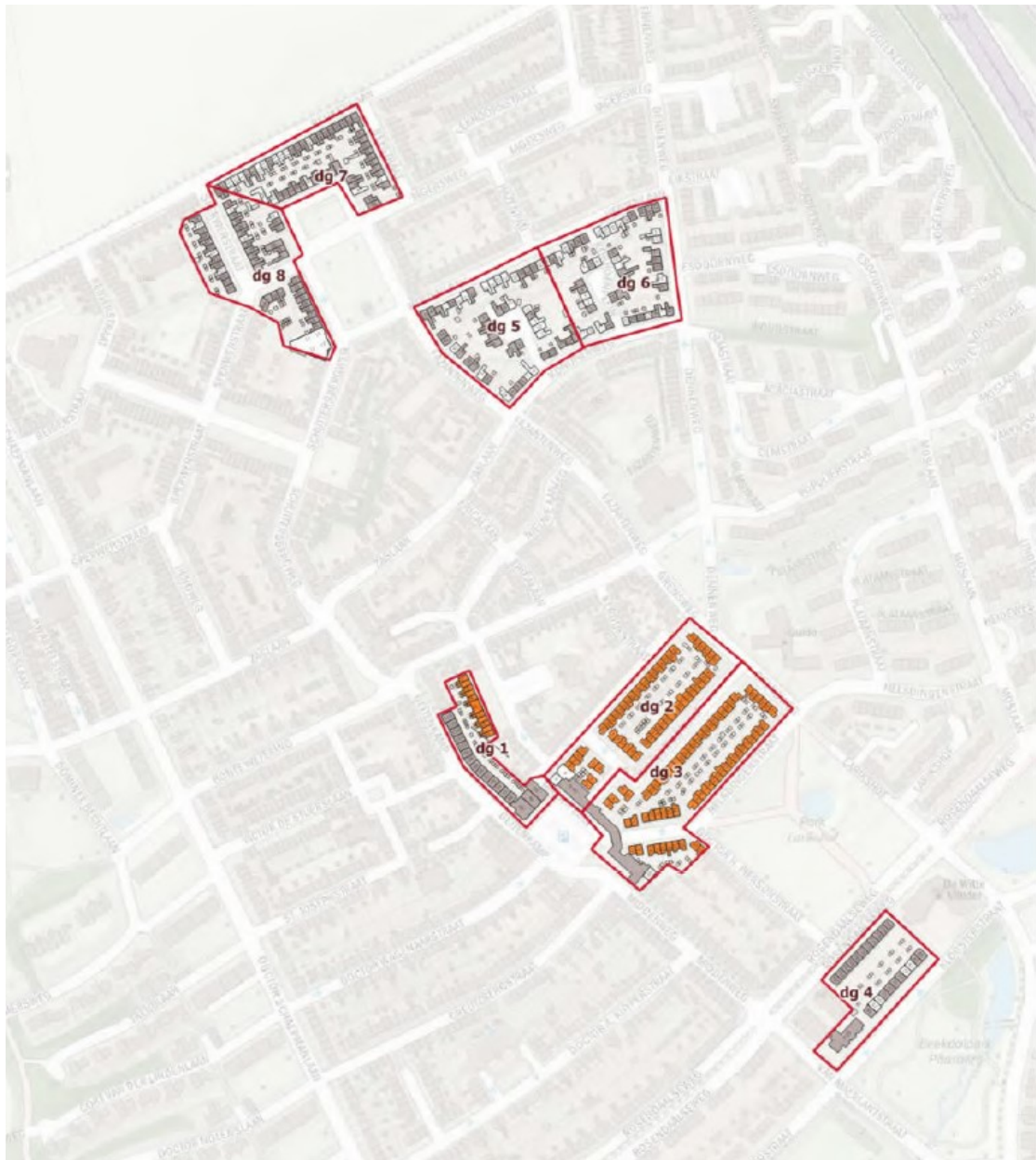
Figuur 1. Ligging plangebied in Arnhem noord in de Geitenkamp