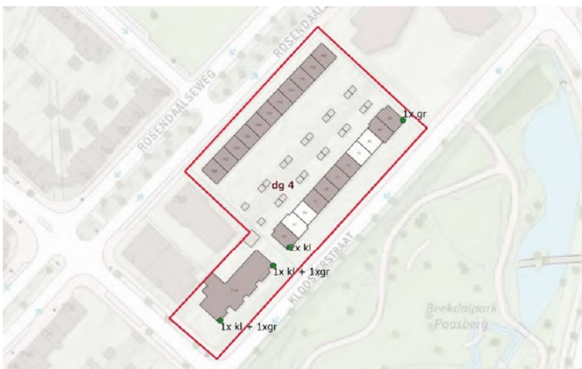
Figuur 3. Deelgebied 4 met locaties van 4 kleine (kl) en 3 grote (gr) kasten