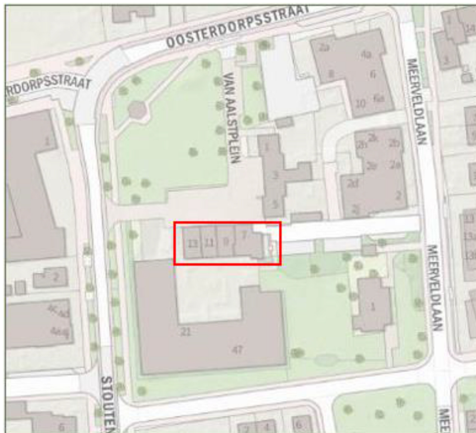
Figuur 1 Kaart van het projectgebied Van Aalstplein 47 te Hoevelaken (Fitskie, 2020).