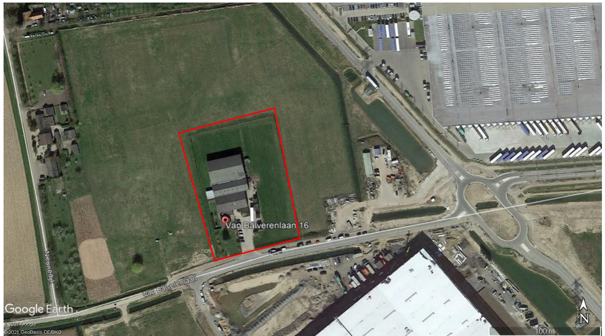
Figuur 2: Ligging van de te slopen gebouwen aan de Van Balverenlaan 16 te Oosterhout.