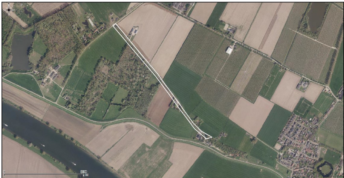
Figuur 2. Begrenzing projectgebied Laaksestraat te Batenburg waar beoogde kapwerkzaamheden worden uitgevoerd.