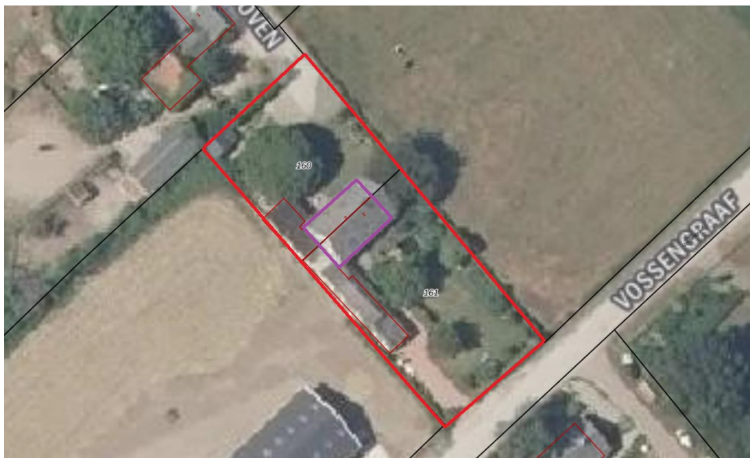
Figuur 2 De woning (de locatie van de werkzaamheden) is aangegeven in paars