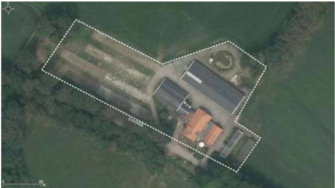
Figuur 1: Plangebied binnen witte stippellijn (Schilderman, 2020)