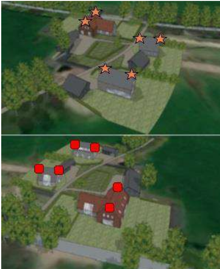
Figuur 3: permanente voorzieningen in de nieuwbouw. Boven in roze de invliegopeningen van de geschikt te maken zolderruimtes voor de gewone grootoorvleermuis; onder in rood de locaties van de inmetselfkasten voor de gewone dwergvleermuis (Schilderman, 2020)