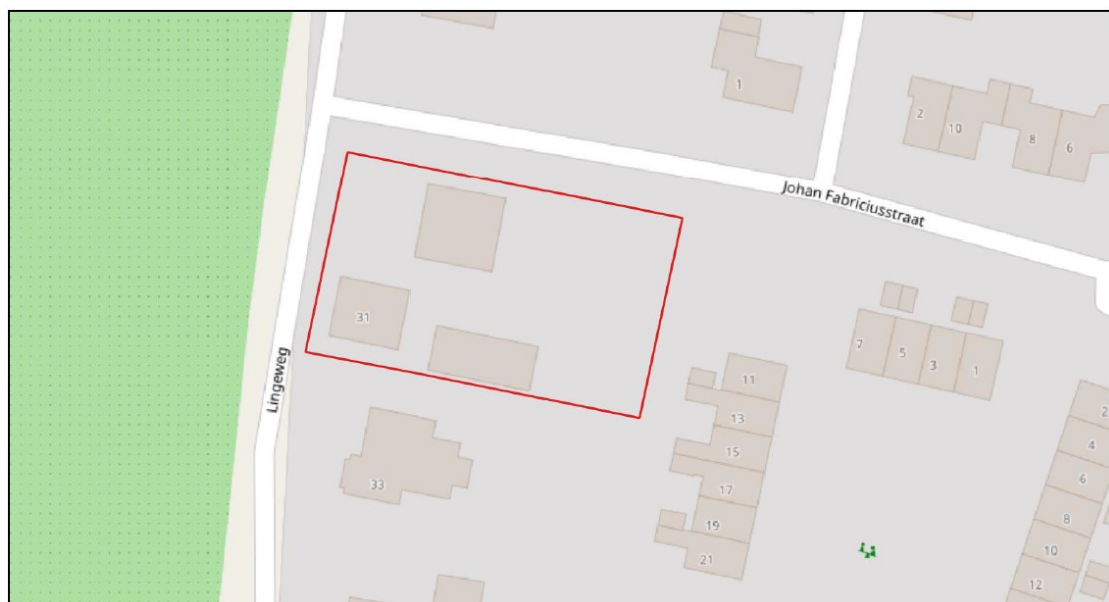
Figuur 2. Ligging en begrenzing projectgebied Lingeweg 31 te Tiel.