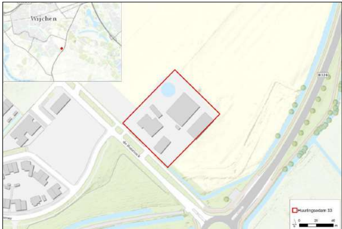
Figuur 1. Ligging en begrenzing (rood omlijnd) van het plangebied aan de Huurlingsedam 33 te Wijchen. De grijze vlakken weergeven de bebouwing, de blauwe cirkel het te verwijderen waterreservoir.