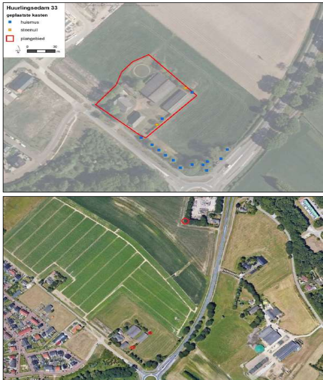
Figuur 2. De locaties van de tijdelijke huismuskasten van het type NK MU 04 van Vivara Pro (blauwe stippen) en de permanente steenuilenkasten van het type UK ST 01 van Vivara Pro (oranje stippen), afbeelding boven. Op de onderste afbeelding is de locatie van de derde steenuilenkast (rode cirkel) ten noorden van het plangebied weergegeven, inclusief de locaties van de twee kasten binnen het plangebied.