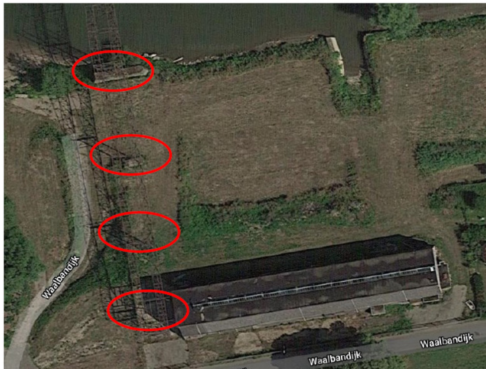
Figuur 1 Kraanbaan waar op de pilaren de tijdelijke vleermuiskasten zijn aangebracht.