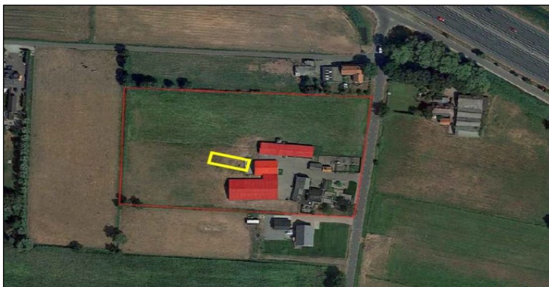
Figuur 1. De ligging en begrenzing van het plangebied aan de Zuiderkade 12A te Ede. Op de bovenste afbeelding is het plangebied rood omlijnd, terwijl het groene vierkant een nestlocatie van huismus weergeeft. De blauwe lijnen geven potentiële nestlocaties van huismus weer, de roze lijnen weergeven potentiële verblijfplaatsen van vleermuizen in de te behouden woning. Op de onderste afbeelding zijn de drie te slopen gebouwen rood gemarkeerd, terwijl de locatie van de nieuw te bouwen woning geel omlijnd is. Het onderzoeksgebied is rood omlijnd.