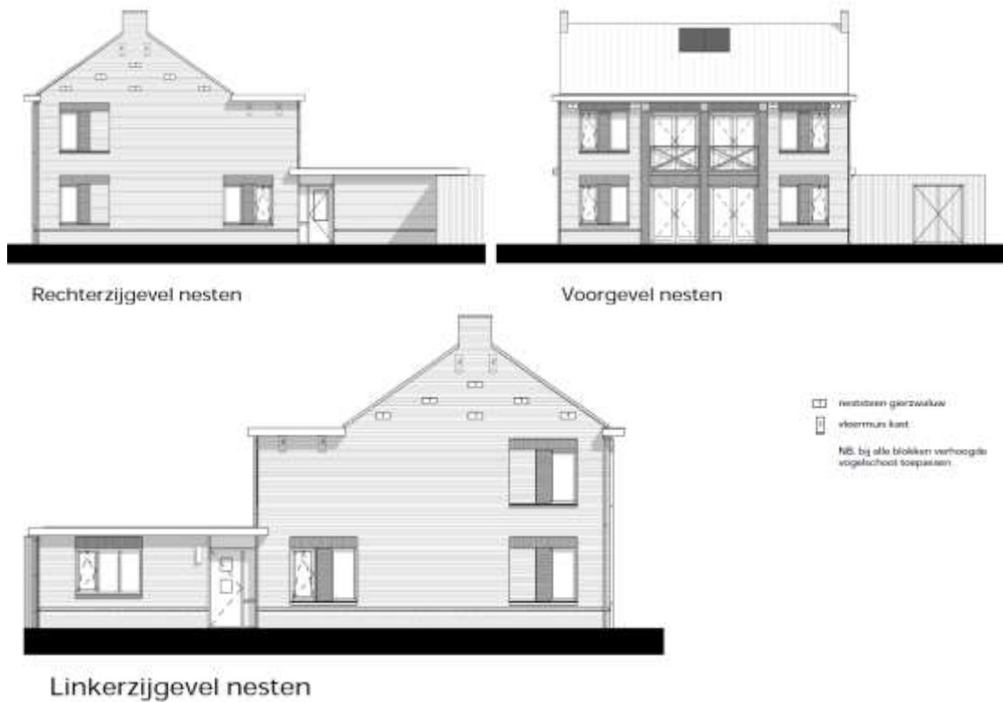
Figuur 4. Detailtekeningen met locaties permanente voorzieningen gierzwaluw en gewone dwergvleermuis in de gevels van de nieuwbouw.