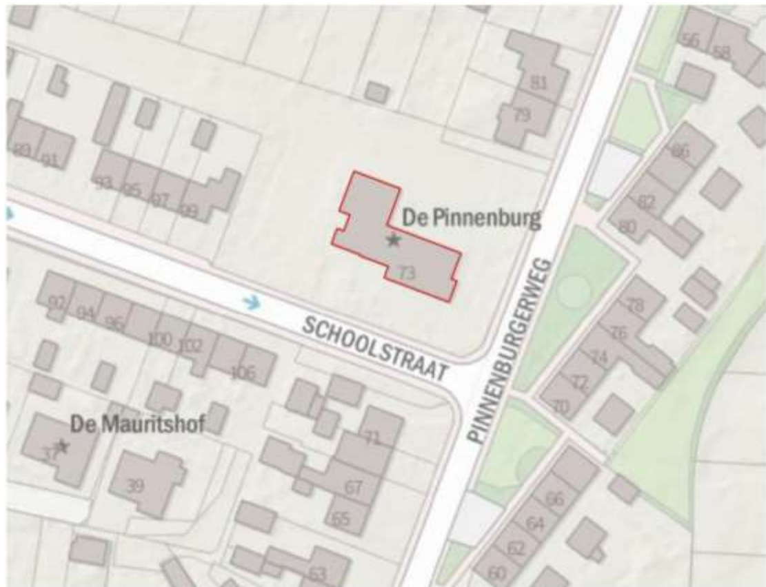
Figuur 1. Ligging en begrenzing te slopen bebouwing aan de Pinnenburg 73 te Putten.