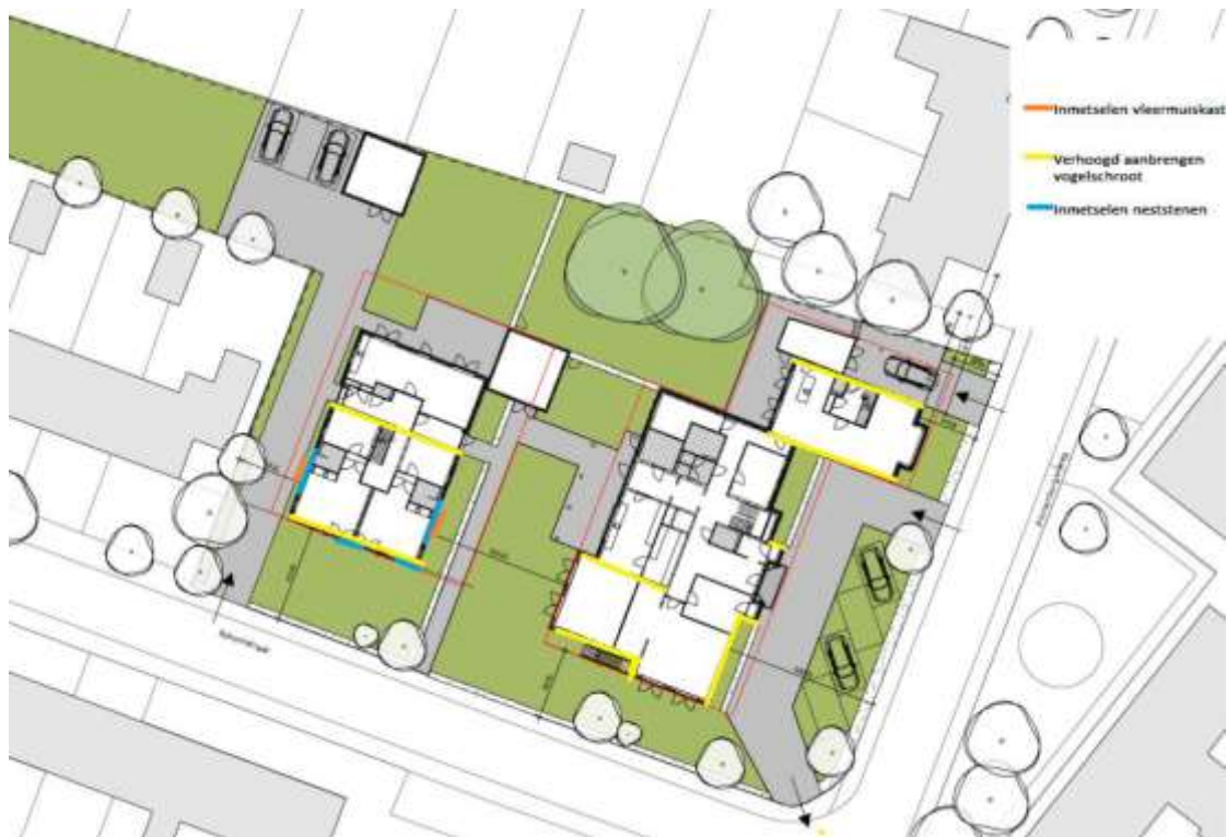
Figuur 3. Locaties permanente voorzieningen voor gierzwaluw, huismus en gewone dwergvleermuis in de nieuwbouw.