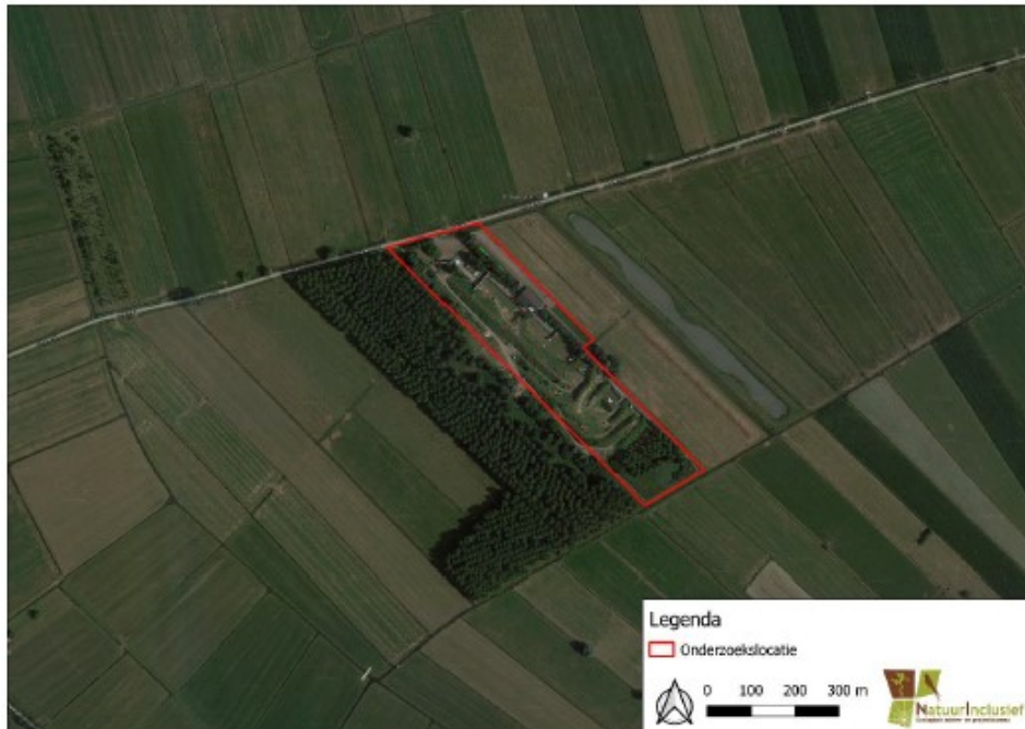
Figuur 1. Ligging en begrenzing van het plangebied, weergegeven met rode omlijning.