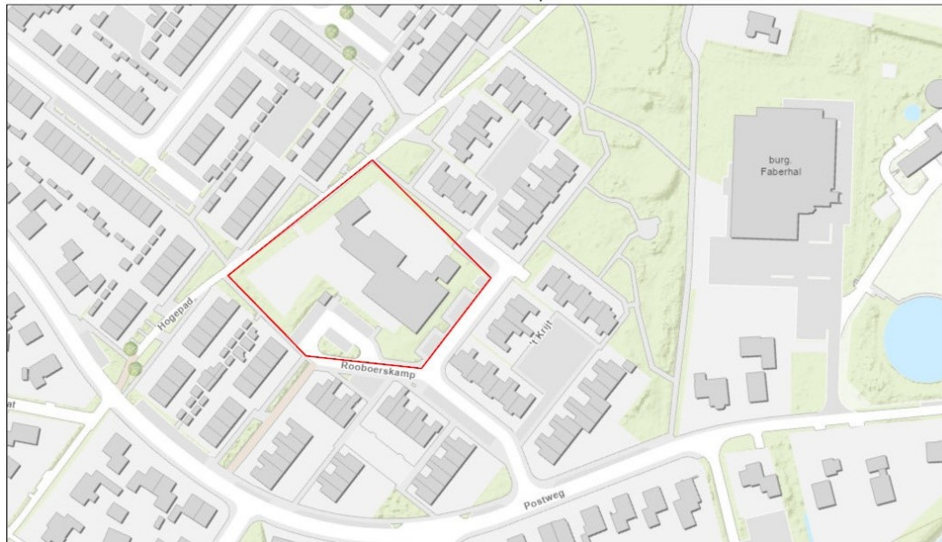
Figuur 1. Ligging en begrenzing plangebied Rooboerskamp te Heerde.