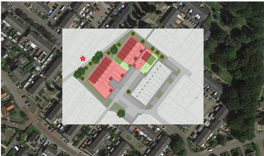
Figuur 2. Locatie ransuilnest (rode ster) en nieuwe inrichting plangebied.