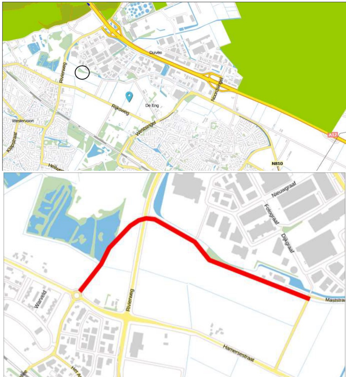
Figuur 1 Ligging (zwarte cirkel) en begrenzing (rode lijn) plangebied.