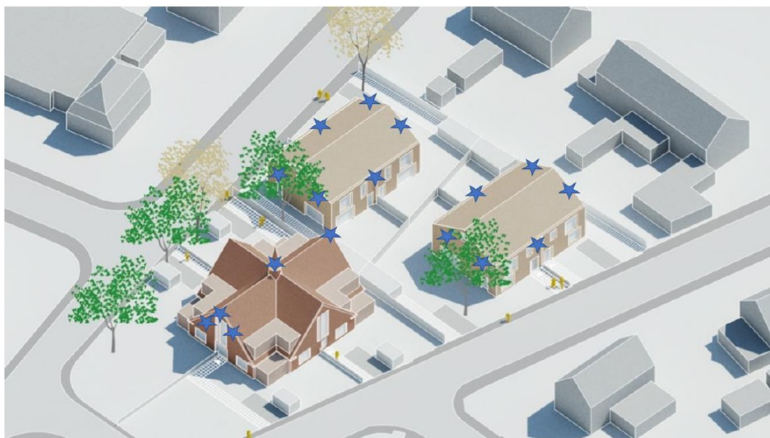
Figuur 3. Nieuwe inrichting en locaties permanente voorzieningen gewone dwergvleermuis (blauwe ster) in het plangebied aan de Lawijckerhof 6 te Wolfheze.

In de onderstaande figuur 4 zijn schematisch de mogelijke locaties voor inbouwkasten weergegeven.