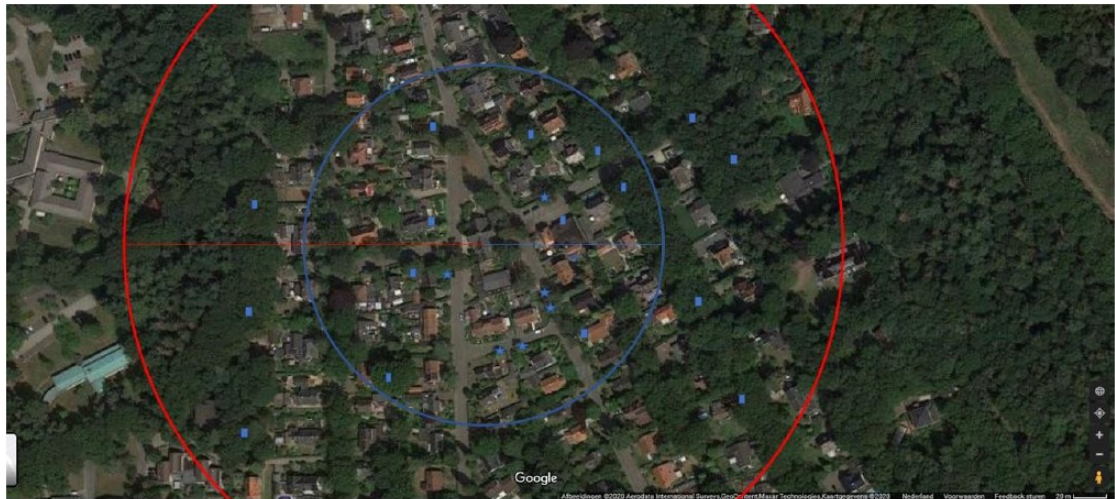
Figuur 2. Locaties tijdelijke vleermuiskasten (blauwe rechthoek) rondom het in het midden van de cirkel gelegen plangebied aan de Lawijckerhof 6 te Wolfheze.