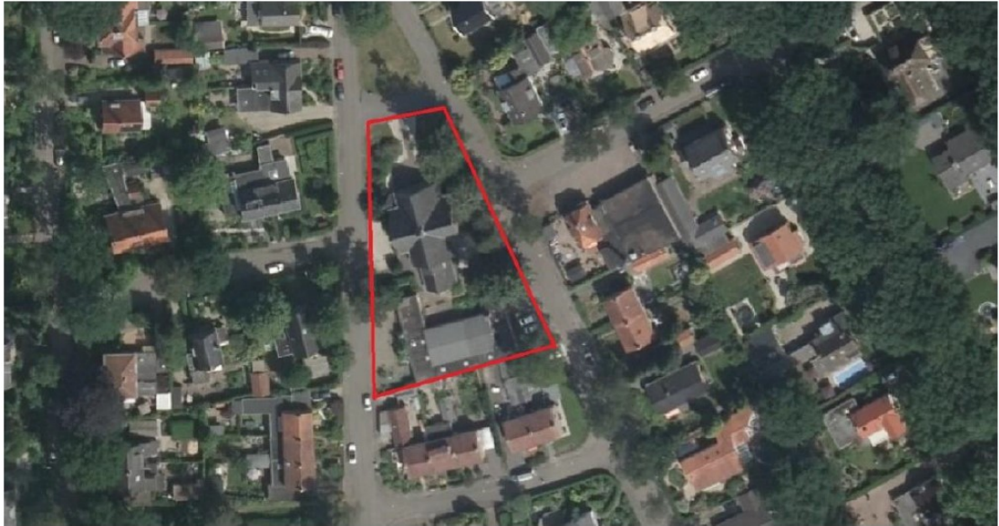
Figuur 1. Ligging en begrenzing plangebied Lawijckerhof 6 te Wolfheze.