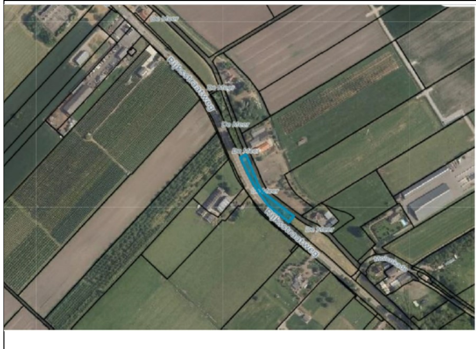
Figuur 3: Ligging van het compensatieperceel aan de Rijksstraatweg te Culemborg (Culemborg M292) met een grootte van 2150 m 2 (herplant met moeraseik).