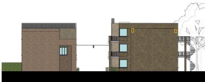
Zijgevel appartementen Steeg zuidzijde – 2 inmetselfleermuiskasten

Linkerzijgevels woningen en appartementen steeg