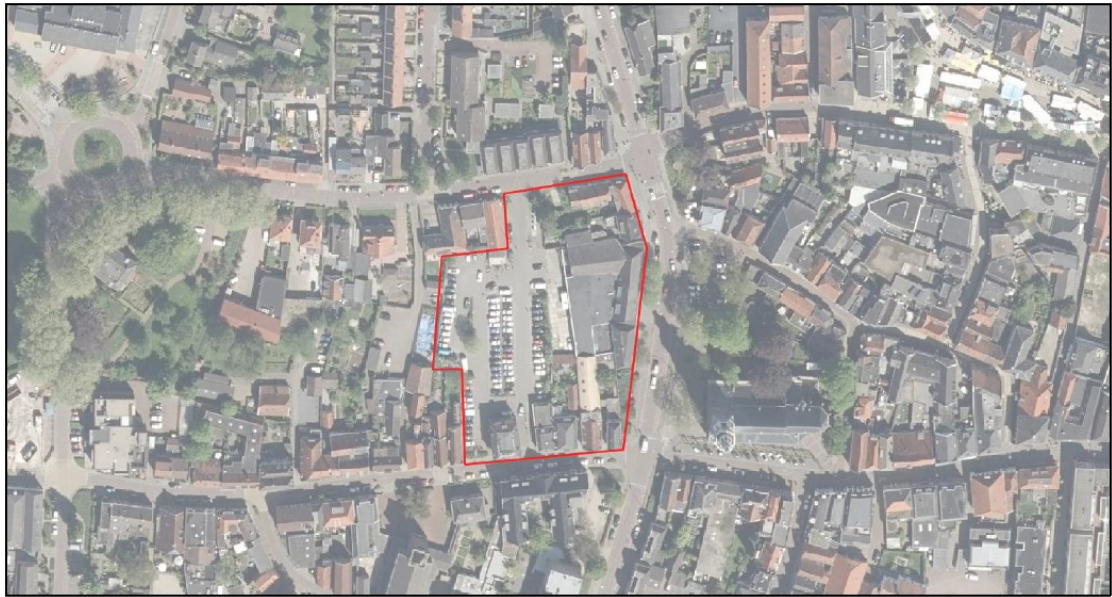
Figuur 1: Ligging plangebied Kerkplein te Nijkerk