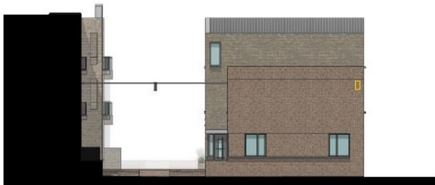
Zijgevel appartementen Steeg noordzijde – 1 inmetselfleermuiskast

Linkerzijgevels woningen en appartementen steeg