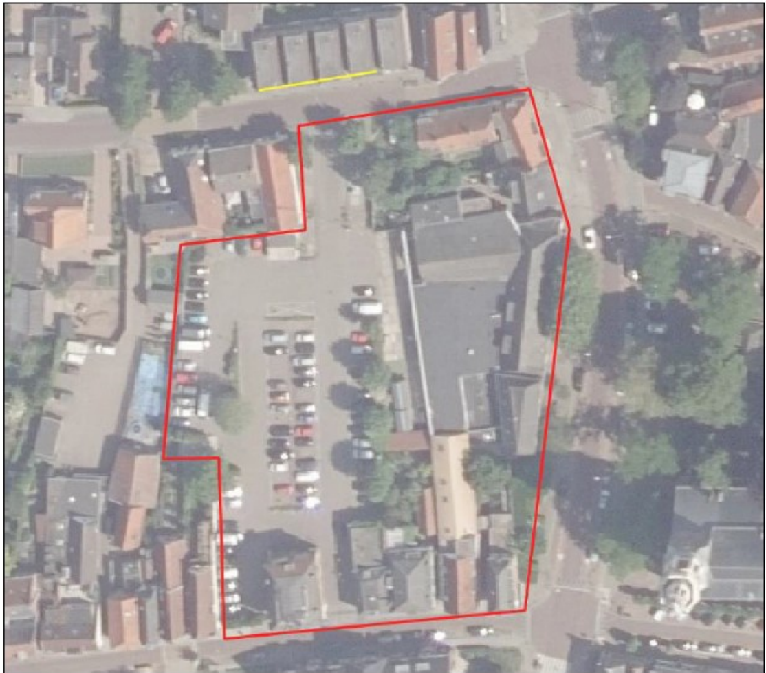
Figuur 3: Ligging tijdelijke verblijfplaatsen (gele lijn) gewone dwergvleermuis.