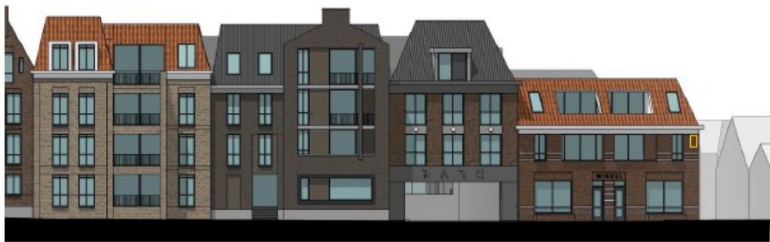
Figuren 9, 10 en 11: Ligging permanente verblijfplaatsen voor vleermuizen