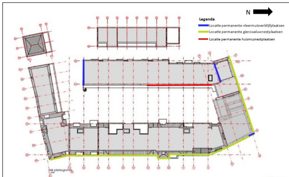
Figuren 12 en 13: Impressie gevel waar de permanente verblijfplaatsen voor huismus gerealiseerd zullen worden en de locaties van de permanente verblijfplaatsen voor gewone dwergvleermuis, gierzwaluw en huismus.