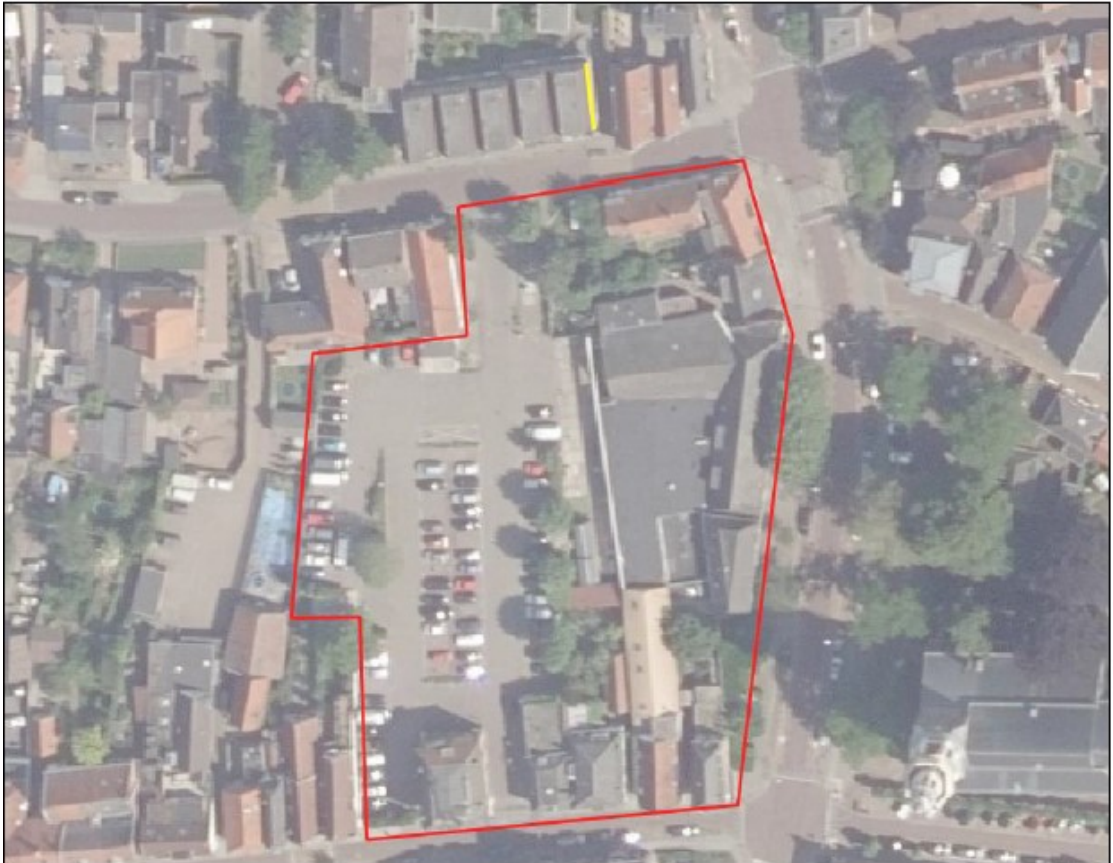
Figuur 5: Ligging tijdelijke verblijfplaatsen (gele lijn) voor huismus