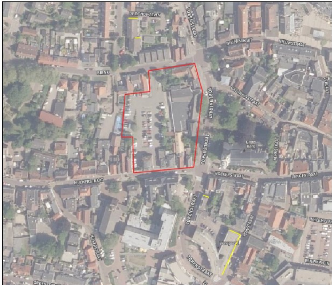
Figuur 4: Ligging tijdelijke verblijfplaatsen (gele lijnen) gierzwaluw