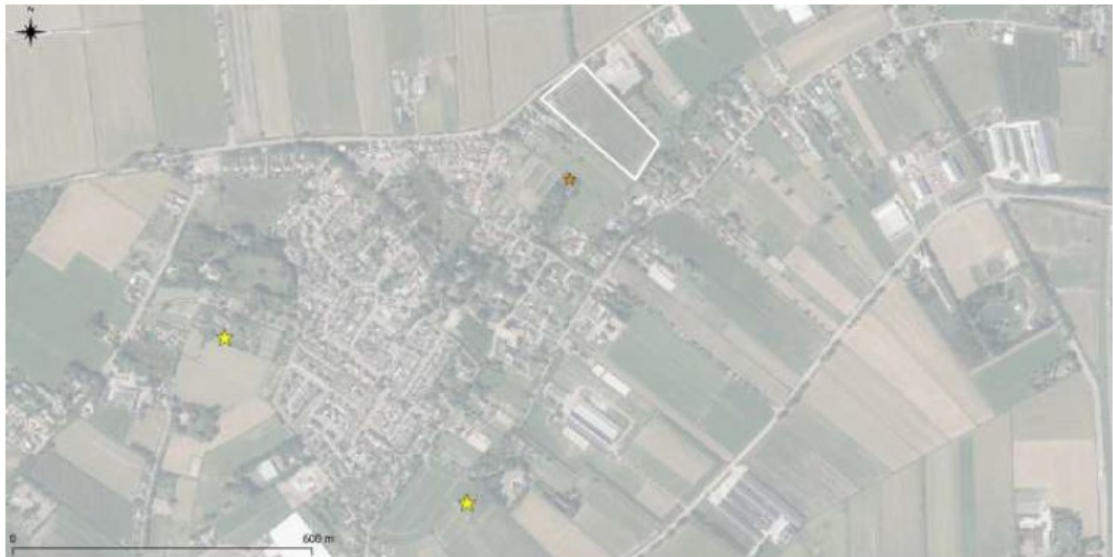
Figuur 3: Locaties nieuwe kasten (gele sterren) en verbetering van een bestaande kast (oranje ster). Het plangebied is met een wit rechthoek aangegeven.