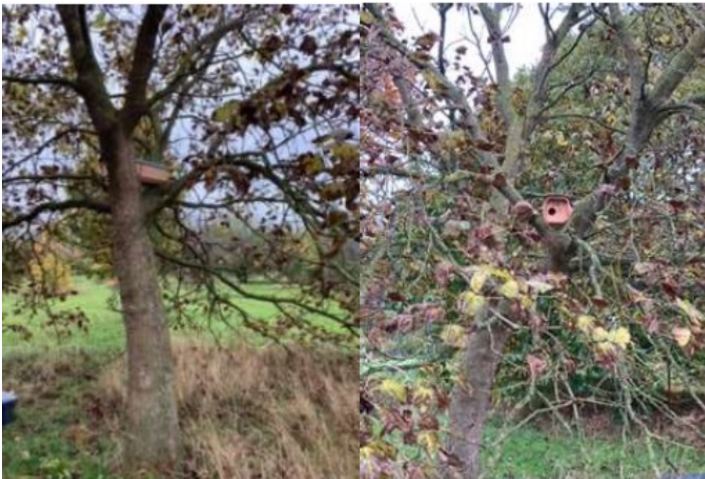
Figuur 4: Opgehangen en verplaatste nestkasten aan Broekheuvelstraat 5, Ottersdam 1 en achterop het terrein van de Groenestraat 4 te Bruchem