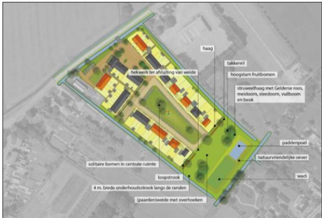
Figuur 2: Schetsontwerp voor de woningbouw en compensatie van het foerageergebied van de steenuil