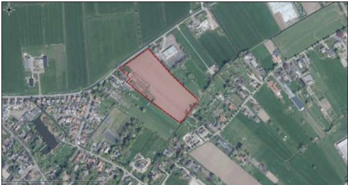
Figuur 1: Luchtfoto van de onderzoeks- en projectlocatie en directe omgeving.