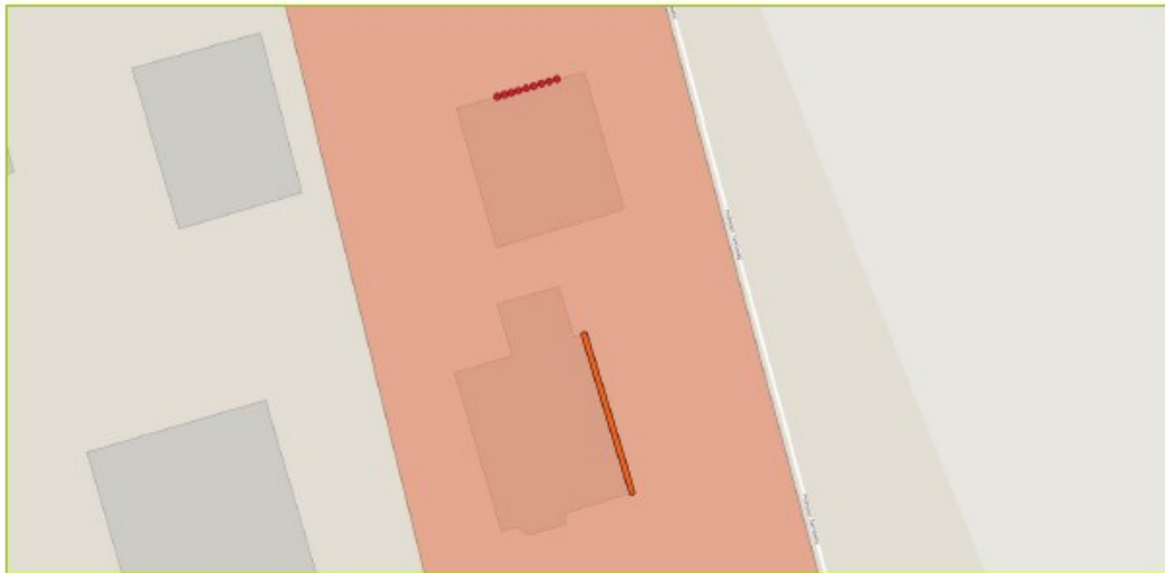
Figuur 1 Locaties tijdelijke maatregelen aan schuur (rode stippen) en geplande locatie permanente verblijfplaatsen (oranje lijn) aan de Van Zwietenlaan 11 te Laag-Soeren. De prefab-vogelvides mogen niet meer toegepast worden als permanente voorziening. Voordat de werkzaamheden van start gaan dient het type permanente verblijfplaats voor de huismus en de definitieve locatie aan de provincie overlegd te worden ter goedkeuring.