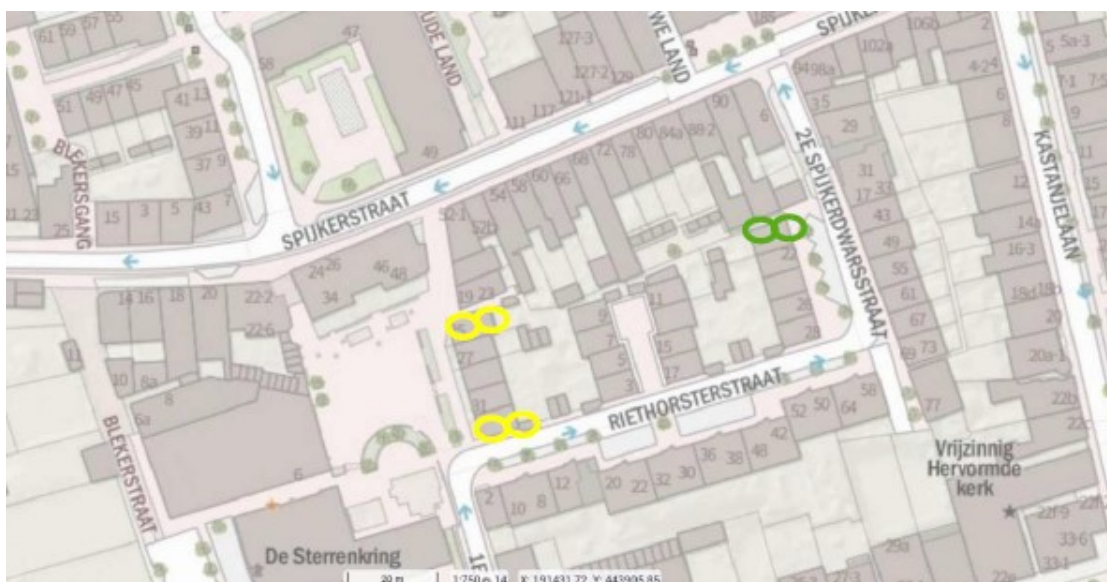
Figuur 3: Permanente mitigatie. Groen: Gierzwaluw. Geel: Gewone dwergvleermuis.