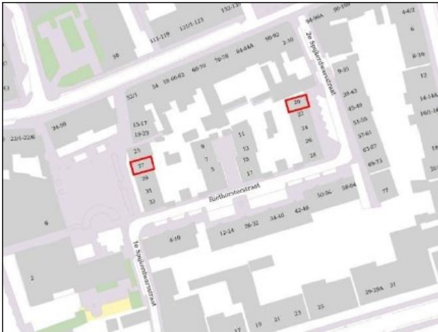
Figuur 1: Plangebied 1e Spijkerdwarsstraat 25 en 2e Spijkerdwarsstraat 33 te Arnhem