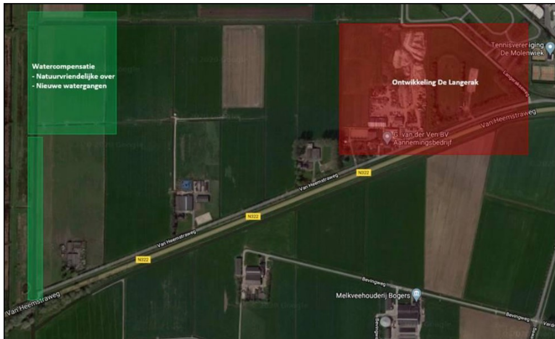
Figuur 3 Ligging compensatiegebied (groene arcering). De locatie van het watercompensatiegebied 800 m ten westen van de planlocatie, zal ook functioneren als alternatief leefgebied van de poelkikker