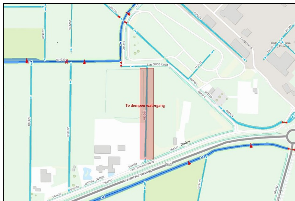
Figuur 2 Te dempen watergang..