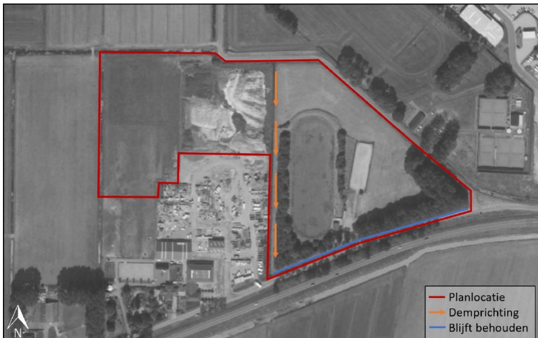
Figuur 4 De werkroute voor het dempen van de kavelsloot.