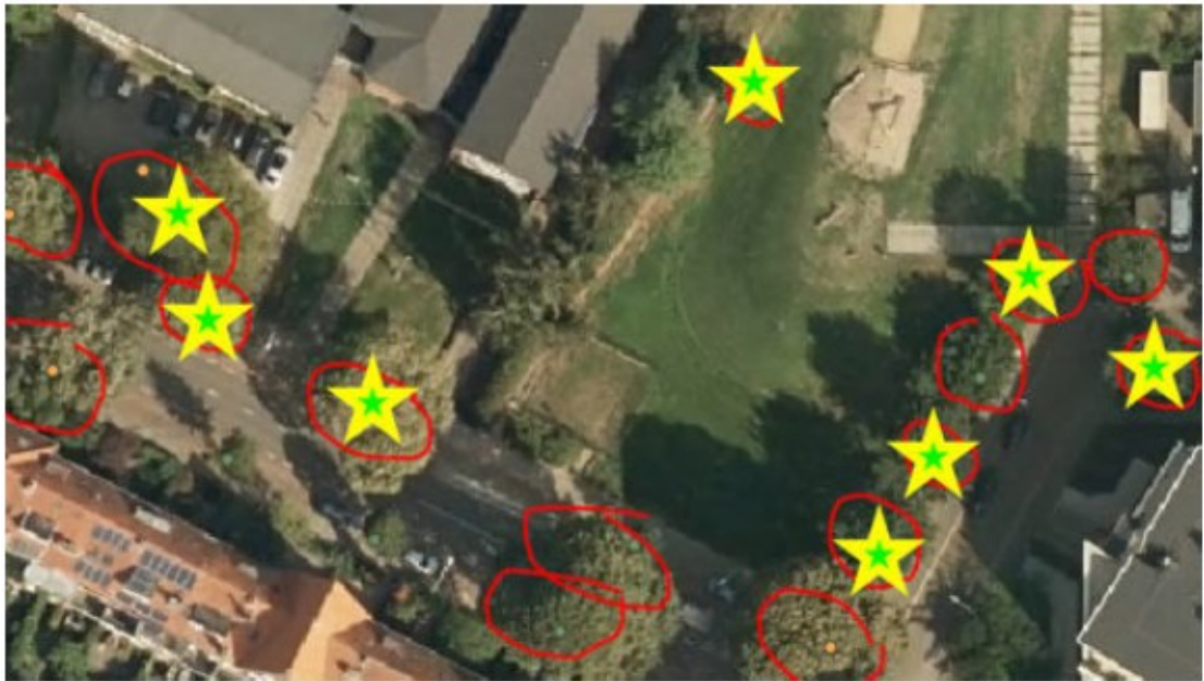
Figuur 3. 8 van de tijdelijke kasten in bomen (geel met groene sterren). Er dienen nog 4 tijdelijke kasten bij geplaatst te worden, bij voorkeur aan bebouwing.