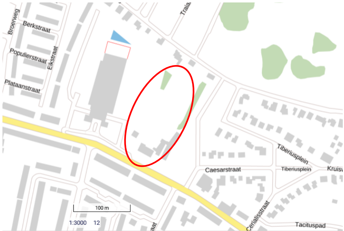
Figuur 2. Globale ligging plangebied (rode ovaal). De te slopen bebouwing ligt aan de zuidoostkant van het plangebied.