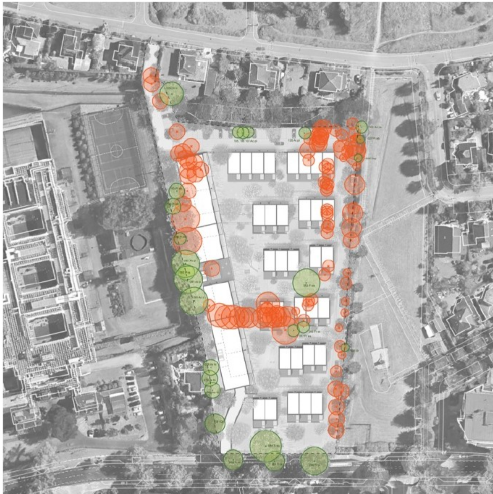
Figuur 1 Grens van plangebied Berg en Dalsweg 293-295 aangegeven met zwarte stippellijn. Op de luchtfoto is het conceptontwerp ingetekend voor de nieuwe bestemming. Te kappen bomen zijn aangegeven met rode cirkels, te behouden bomen met groene cirkels. Aan de linkerkzijde van de foto de gevangenis en aan de rechterzijde een openbare groenstrook met gazon en speeltoestellen.