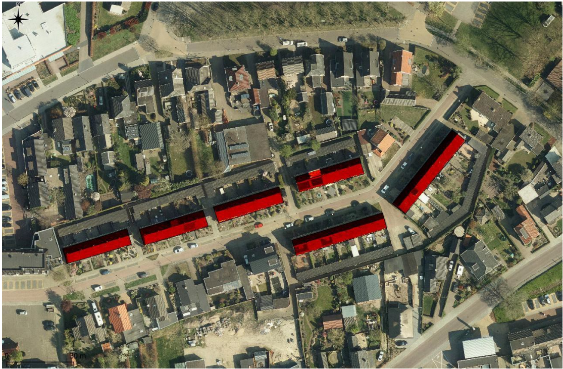
Figuur 1: Plangebied aangegeven met rood (Boogaard, 2020)